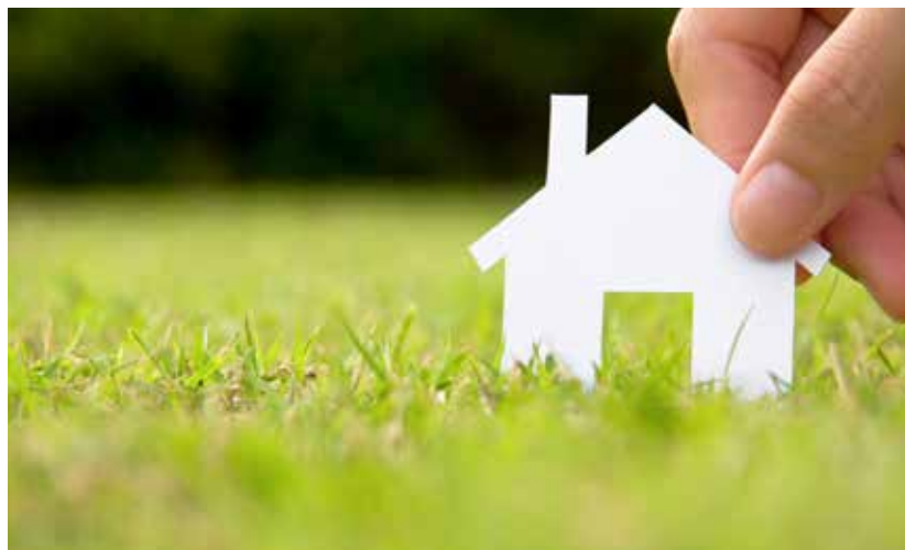
A propriedade privada vem do temor que busca segurança à custa da liberdade. Uma sociedade baseada na propriedade privada é uma sociedade baseada no temor

Dentro desta lógica verificamos o surgimento e espraiamento das instituições prisionais como também forma dessa casa, desse refúgio, mas um alargamento