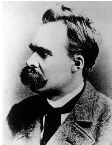
De acordo com o filósofo alemão Friedrich Nietzsche, o bem e o mal são fundamentos excludentes de formação da moral

A essa moralidade proposta, chama de “moralidade nobre”, por meio da qual não é necessário eliminar a negatividade. Há uma noção de todo. No exemplo anterior do despertar e decidir sobre banho ou café, não há mal, não há certo ou errado sequer. Há uma disputa, uma luta entre possibilidades, apenas. Nietzsche escreve que “o ‘desenvolvimento’ de uma coisa,