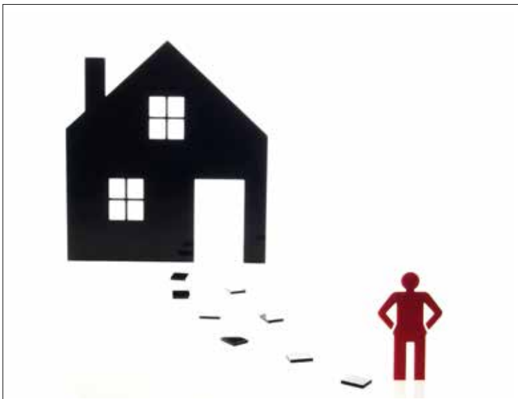
Estar fora de casa, estar no mundo, representa uma ameaça que é o mundo como tal e destaca a angústia que essencialmente constitui o “ser no mundo” heideggeriano

com o próprio ser no mundo; por isso há a possibilidade de se acessar o ser da presença pela compreensão da disposição que é a angústia.