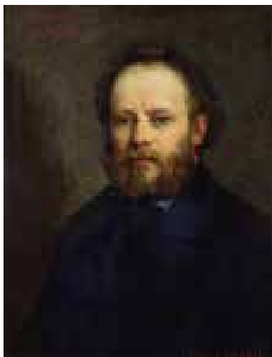
Segundo Proudhon, a propriedade privada e, conseqüentemente, o acúmulo de capital são as principais causas da manutenção da desigualdade social

Quando se pensa em julgamentos morais, comumente vêm-