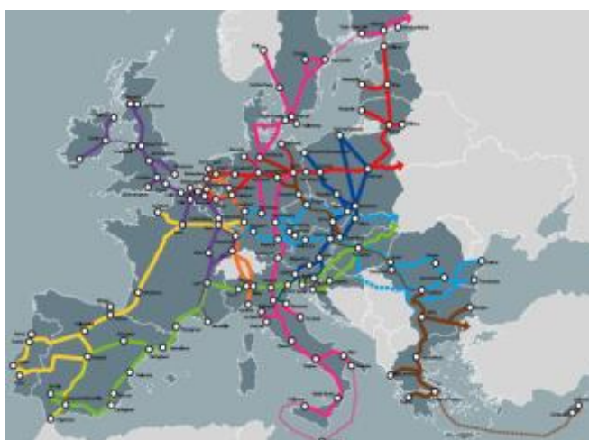
Mapa 1. Red Transeuropea de Transportes (RTE-T): Corredores Territoriales