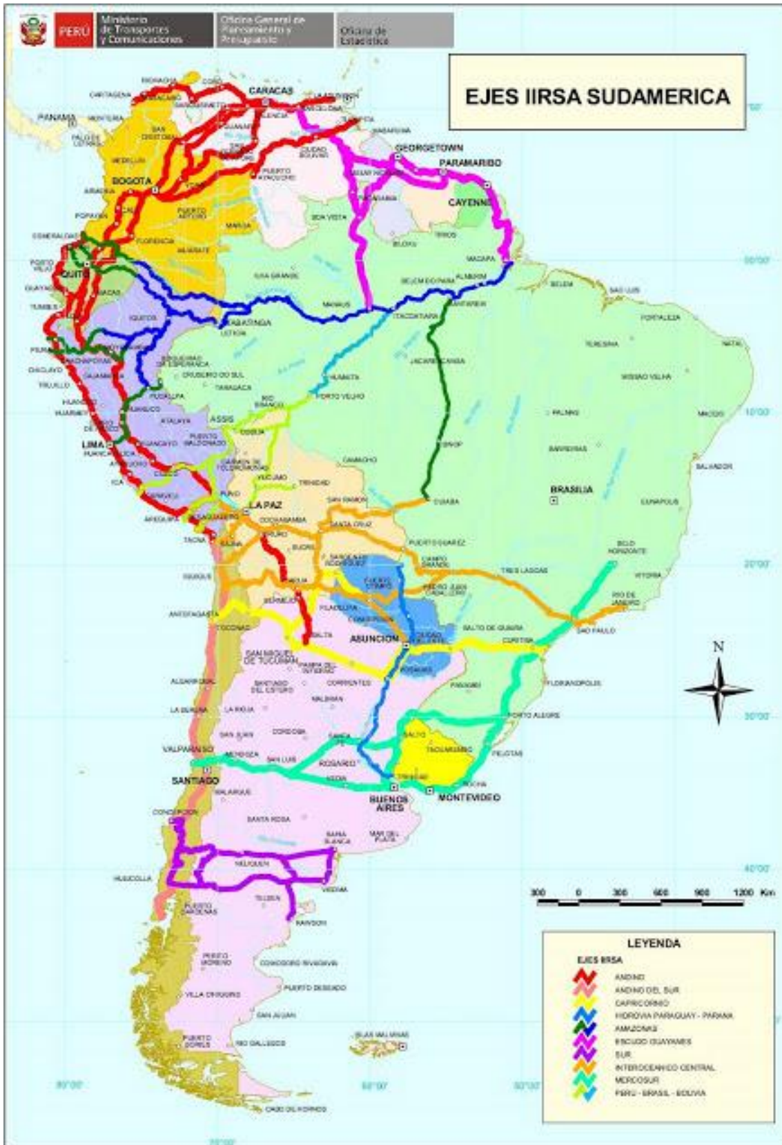
Mapa 2. IIRSA: EJES DE INTEGRACIÓN Y DESARROLLO (EID)