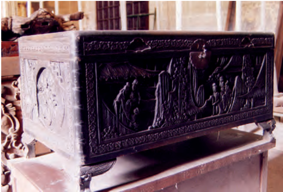
Fig. 5. Arcón. Convento de San Agustín. Manila.