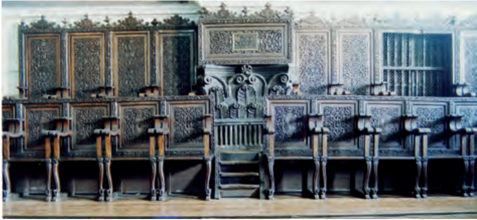
Fig. 2. Sillería de coro. Convento de San Agustín. Manila.

de ella una obra única dentro del contexto hispánico. Los asientos son abatibles y presentan una sencilla misericordia o paciencia sin decorar. Se encuentra en buen estado de conservación aunque la sillería había estado pintada desde el siglo XIX en un tono oscuro para protegerla del ataque de las termitas, recobrando su color original en la restauración llevada a cabo entre los años de 1969 y 1970. 6