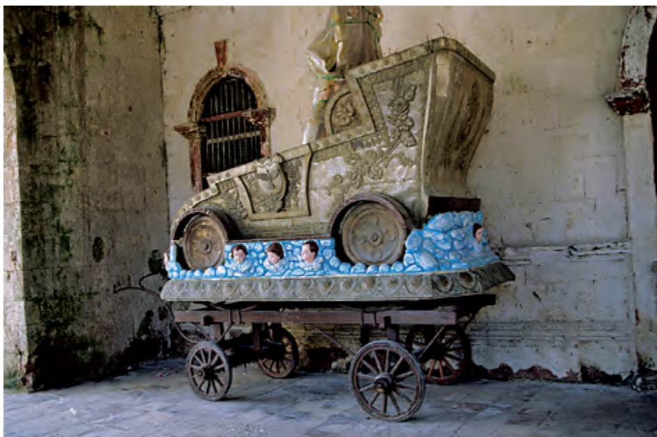
Fig. 10. Carroza. Parroquia de Panglao. Bohol.

de gran interés de diferentes conventos del archipiélago, todavía queda una ardua tarea de inventariar y catalogar piezas repartidas por pequeñas parroquias, algunas de gran originalidad, actualmente sin uso y por tanto en peligro de perderse irreversiblemente. 19