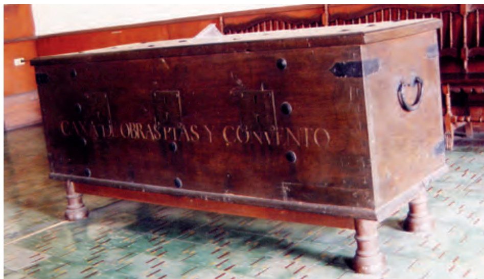
Fig. 6. Arcón. Convento de San Agustín. Manila.

el virreinato de la Nueva España sostuvo con Filipinas. El autor oriental de la pintura captó el alzado de los edificios civiles y religiosos tal como se encontraban antes de la década de 1660. Son también relevantes los personajes que aparecen caminado por las calles, especialmente los que se encuentran en el extremo inferior derecho, pues constituyen un reflejo de los modelos representativos que cohabitaban en ese momento en la ciudad de Manila: españoles a pie y a caballo, religiosos de distintos hábitos y personajes con atuendo oriental. 10