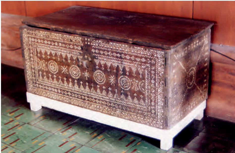
Fig. 3 Arcón. Convento de San Agustín. Manila.