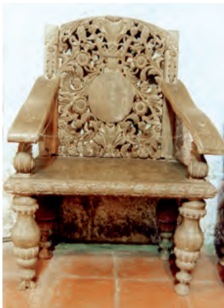
Fig. 8. Sillón. Convento de San Agustín. Manila.