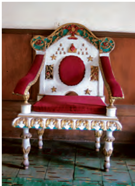
Fig. 9. Sillón. Convento de San Agustín. Manila.

quinas y en las patas. La parte alta del respaldo está profusamente labrada con volutas y un óvalo. En el centro del respaldo se representa el águila bicéfala con corona imperial, rodeada de una profusa decoración vegetal. 14 Esta iconografía, muy utilizada como motivo ornamental en la orfebrería y el mobiliario, se ha querido relacionar con el emblema de los Ausburgo, máxime cuando en Filipinas fue otorgado a la estatua del Santo Niño de Cebú. No obstante, Heredia Moreno abordó el tema iconográfico del águila bicéfala en una serie de custodias del siglo XVII, desvinculándolo del símbolo imperial ya que éste se había eliminado del escudo del rey desde tiempos de Felipe II y otorgándole otro de carácter religioso. El tema tuvo tanto éxito que se difundió dentro y fuera de la Península hasta el siglo XIX, aunque en muchos casos perdió, con el transcurso del tiempo su primitivo significado simbólico y sufrió notables variaciones. 15 Las mismas características formales y estilísticas se dan en el banco que se encuentra en la portería del convento, aunque probablemente se pueda fechar en el siglo