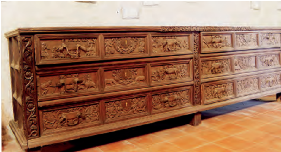
Fig. 7. Cajonería. Convento de San Agustín. Manila.

Estos mismos temas donde se muestra la vida y costumbres de los habitantes del archipiélago se aprecia en un par de escritorios que recuerdan por la tipología a los españoles del siglo XVIII, pero los apoyos en forma de máscaras y los motivos de nubes de las cantoneras tienen procedencia oriental. En uno de ellos el frontal, con la tapa abatible, se compartimenta por medio de cajones rectangulares con personajes entrelazados con los motivos vegetales muy carnosos, mientras que en el cajón central se representan la escena de Adán y Eva en el Paraíso, con el árbol con la serpiente