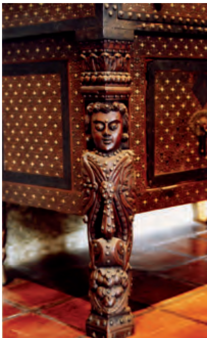
Fig. 4. Mesa. Detalle Convento de San Agustín. Manila.

tacar la calidad de los muebles chinos que mantuvieron siempre un diseño simple, de proporciones muy cuidadas y la elección de maderas de alta calidad, que con un perfecto dominio de la técnica de ensamblaje, conjugaron belleza y utilidad. No obstante, es muy difícil su periodización dada la continuidad estilística y técnica que se produjo durante el siglo XVI y XVII, siendo más fácil identificar el mobiliario ejecutado en los siglos XVIII y XIX por el gusto ornamental de la época y por la influencia de occidente que se advierte en ellos [fig. 5].