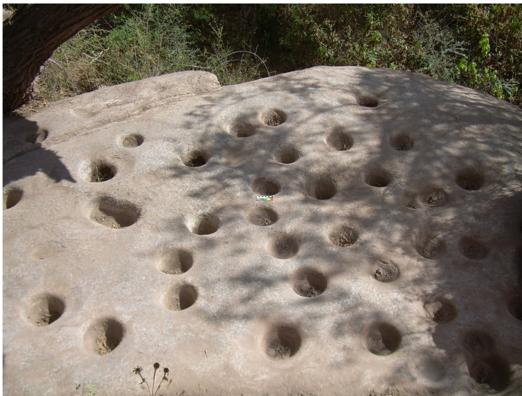
Figura 2. Mortero múltiple, conjunto EGP

se encontraran lo suficientemente cubiertas de sedimento que permitiera inferir que no fueron utilizados en mucho tiempo, es decir con prácticamente nulas probabilidades de reutilización reciente. El instrumental en todos los casos fue cuidadosamente limpiado luego de la extracción de cada uno de los morteros.