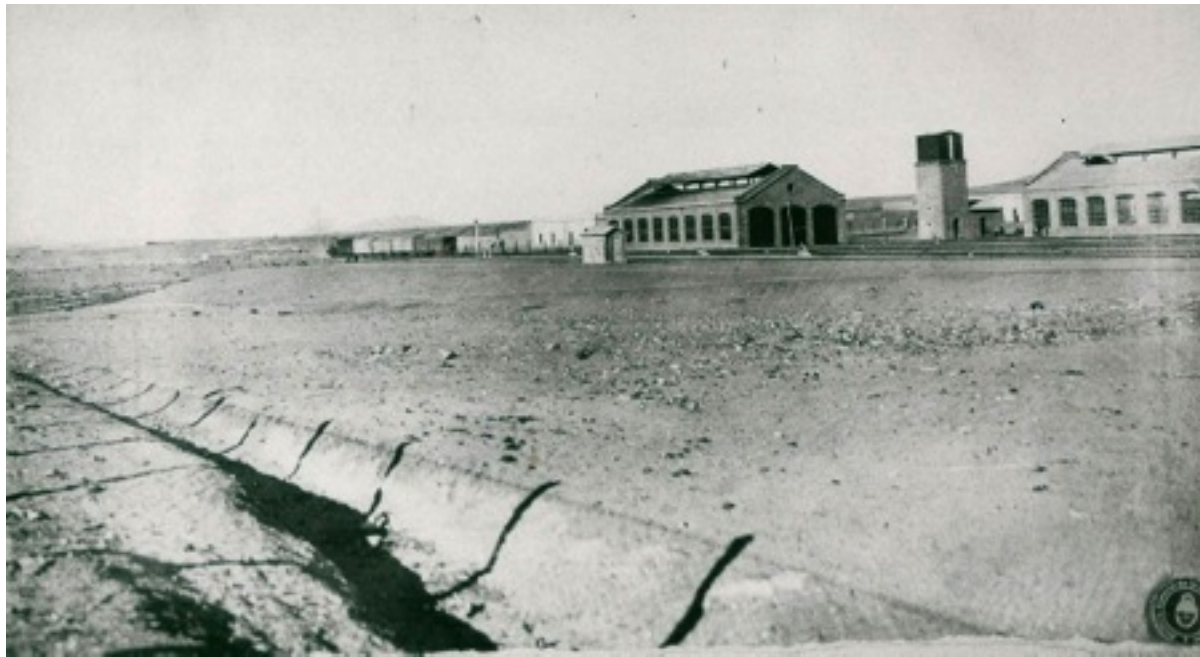
Figura 2. Estación La Quiaca a principios del siglo XX.