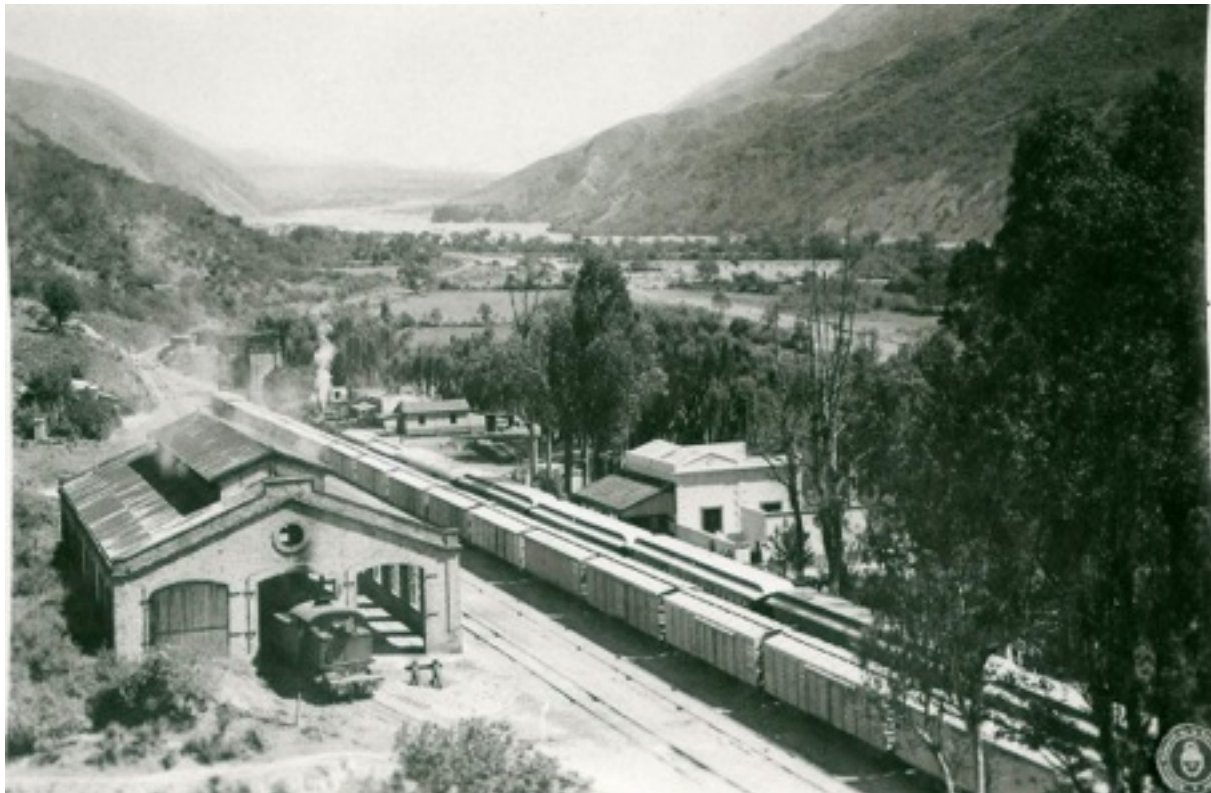
Figura 3. Estación León a principios del siglo XX. Al fondo el Valle del Río Grande en la Quebrada de Humahuaca.

población esparcidos en las márgenes del Río Grande y de los ríos Reyes, –en que existen los baños termales–, Yala, Lozano y León” (MINISTERIO DE OBRAS PÚBLICAS, 1902: 34).