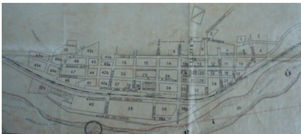
Figura 4. Plano del pueblo de Humahuaca del año 1967.

En los pueblos preexistentes o Pueblos de Indios, la instalación del ferrocarril tuvo un modo diferente de insertarse o vincularse puesto que prevaleció la necesidad orográfica de la traza. En Purmamarca la estación se ubicó a 3km alejada del poblado, por la imposibilidad de llevar el riel hasta el allí y en Tilcara, también lo hizo alejado del pueblo y en la margen opuesta. En Tumbaya, Huacalera y Uquía, la estación se instaló en el borde de la traza y en Humahuaca, en cambio, se situó frente a la plaza principal en una estrecha centralidad (FERRARI, 2010).