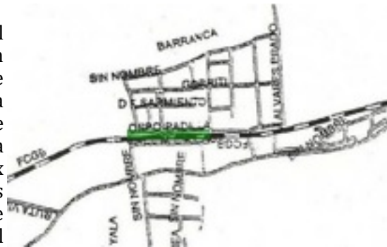
Figura 11. Plano del pueblo de Yala, en color se señala el cuadro de estación.

Yala, ubicado muy cerca de San Salvador de Jujuy, es el resultado de una traza que también fue creciendo en forma espontánea y por lo tanto sus manzanas son de diferentes formas y tamaños. Su organización se basa en dos grandes módulos situados frente al cuadro de estación de aproximadamente 235 m (frente a estación) x 185m y otra 140 m. (frente a estación) x 180m. Luego el resto se acomoda en manzanas cuadradas y rectangulares en un tejido que tiene como límite a la ruta por el este, al Río Yala por el Norte y el Río Grande por el sur. La plaza ocupa una parcela dentro de la manzana quedando rodeada de edificaciones.