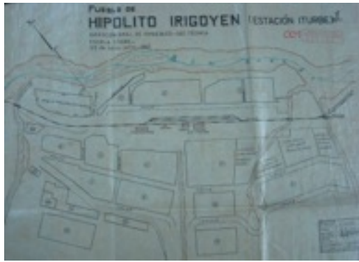
Figura 10. Plano de 1967 del pueblo Hipólito Irigoyen, luego denominado Iturbe de acuerdo al nombre que tomó la estación de ferrocarril.

regularidad dentro de la irregularidad. Las viviendas más antiguas fueron construidas en mamposterías de adobe y se ubicaron en el lateral este del cuadro de la estación, dando lugar a la habitual disposición alineada. El escaso espacio en el que se insertó la estación y el pueblo ha impedido el crecimiento por extensión dentro del valle. De tal manera que su crecimiento se produjo sobre barrancas colindantes e inclusive del otro lado del Río Grande. Hipólito Irigoyen no tiene ley de fundación y tampoco se han encontrado planos de la época de la llegada del ferrocarril. Sin embargo, los planos más antiguos certifican lo que puede apreciarse durante el trabajo de campo, una organización lineal paralela a ambos lados del espacio ferroviario, funcionando éste último como una gran plaza longitudinal integrada con el espacio circundante.