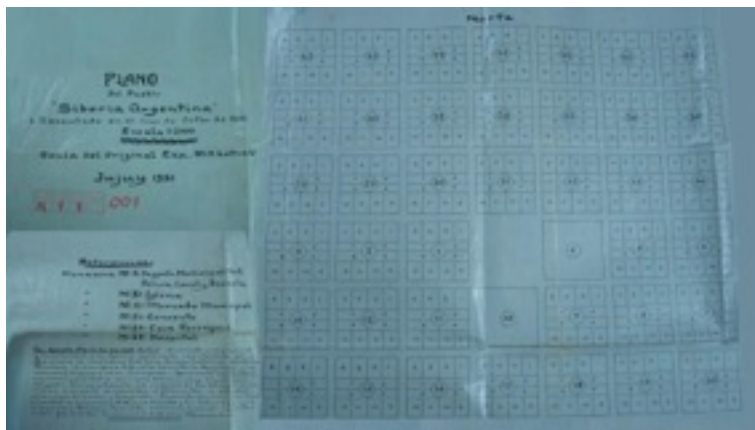
Figura 6. Plano de Abra Pampa de 1931. Copia del original de 1883.

La arqueología ha demostrado que en el propio sitio de la ciudad actual se encontraron entre 1904 y 1907 ruinas prehispánicas muy deterioradas que pertenecieron al Período de Desarrollos Regionales entre el 800 y 1470 D.C. (JUJUY. Diccionario General, 1993. Tomo I: 42). En 1892 ya existía una estafeta postal conocida con el nombre de "Siberia Argentina" aunque se ignora la fecha en que se inició el servicio telegráfico. El 14 de agosto de 1883, la legislatura de la provincia sancionó una ley mediante la cual se fijaba la necesidad de fundar un pueblo en el