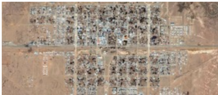
Figura 7. Fotografía aérea de Abra Pampa.

la manzana situada al norte de la plaza para la Iglesia y la ubicada al este, para juzgado municipal, cárcel, policía y escuela; en el extremo sudoeste de la plaza se colocó el mercado municipal y en el segundo módulo hacia el oeste a partir de donde se ubicó la iglesia, se planificó la casa parroquial. De este modo, quedó conformado el tejido de la ciudad donde los edificios cívicos y la iglesia