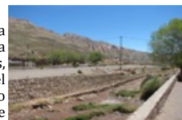
Figura 9. Cuadro de estación en Tres Cruces.

Tres Cruces es uno de los poblados que han crecido en forma espontánea, sin una planificación de los espacios urbanos y sin una ubicación jerárquica de edificios. El tejido se organizó en dos áreas, una disposición alineada al pie de la montaña y paralela a la vía del ferrocarril y una trama en retícula ubicada del otro lado del cuadro de estación. Como en varios pueblos nacidos como consecuencia de la instalación del ferrocarril los primeros indicios de urbanización se situaron en el perímetro del cuadro de la estación.