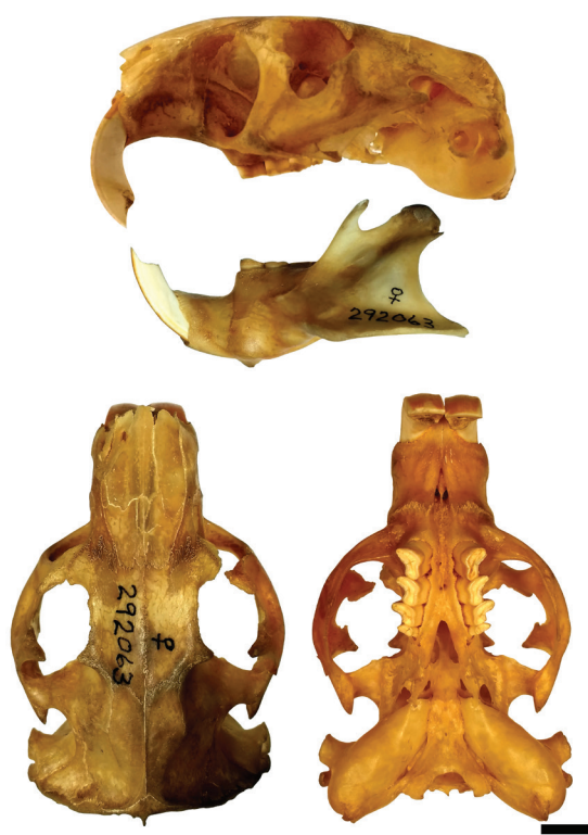
Fig. 1. Cráneo en vista lateral (arriba), dorsal (abajo, izquierda) y ventral (abajo, derecha) y mandíbula izquierda en vista labial (centro) de Tenomys conoveri de río Itiyuro, Tonono, Salta, Argentina (USNM 292063). Escala = 5 mm.

El espécimen en cuestión, una hembra adulta capturada en río Itiyuro (22°30' S, 63°30' O; Fig. 3), Tonono, Provincia de Salta, puede ser referido a C. conoveri sobre la base de una combinación única de rasgos morfológicos, incluyendo: pelaje largo y grueso, de coloración canela uniforme, más oscuro hacia a la línea media; cola bien cubierta de pelos rojizos, más claros hacia su porción ventral; cráneo masivo y angular, con el yugal excavado en su porción anterior y con un proceso dorsal alto (Fig. 1); incisivos superiores anchos y robustos, ligeramente proodontes y con la superficie anterior acanalada (Fig. 2). Esta combinatoria de caracteres coincide con la mencionada en la diagnosis de la especie presentada por Osgood (1946). Una identificación similar fue realizada previamente