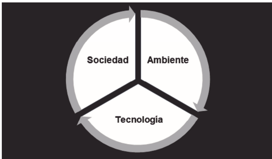
Figura 1. Esquema que sintetiza la relación dialéctica entre sociedad, tecnología y ambiente.

Desde nuestra perspectiva, el ambiente constituye una arista importante en el estudio de la tecnología en tanto que provee el contexto de recursos materiales que los seres humanos necesitan para su desarrollo (Figura 1). No obstante, la configuración social de este contexto es específica de cada espacio socio-histórico; dado que la simple existencia de un recurso dentro de un espacio y momento dados no implica, mecánicamente, su inclusión dentro de las dinámicas de apropiación, explotación y gestión por parte de un grupo humano. De esta manera, el medio ambiente no actúa como determinante mecánico de la tecnología, ya que cada sociedad percibe y se apropia de los recursos de un ambiente de acuerdo a sus dinámicas económicas, conformadas tanto por sus necesidades sociales, como por sus alternativas técnicas, es decir, crea su ambiente a través de la acción o selección (Van der Leeuw 1994), conformando el Medio Histórico. Además, tanto necesidades sociales como alternativas técnicas deben ser entendidas como elementos cuyo rasgo definitorio es una existencia dinámica y en constante transformación (Briz et al. 2014). Por lo tanto, considerar a la tecnología como respuesta inevitable a constreñimientos inmutables niega la dinámica inherente a los fenómenos ambientales, así como el rol de los organismos en su modificación.