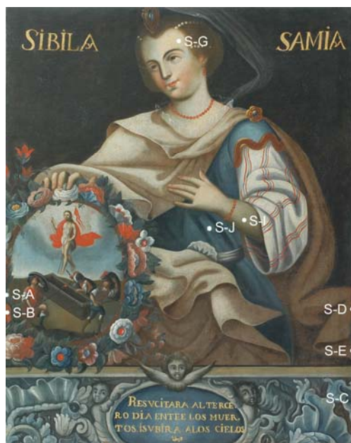
Figura 2. Pintura al óleo de la Sibila Samia en donde se indican los códigos de las muestras extraídas para la identificación de los pigmentos [27].