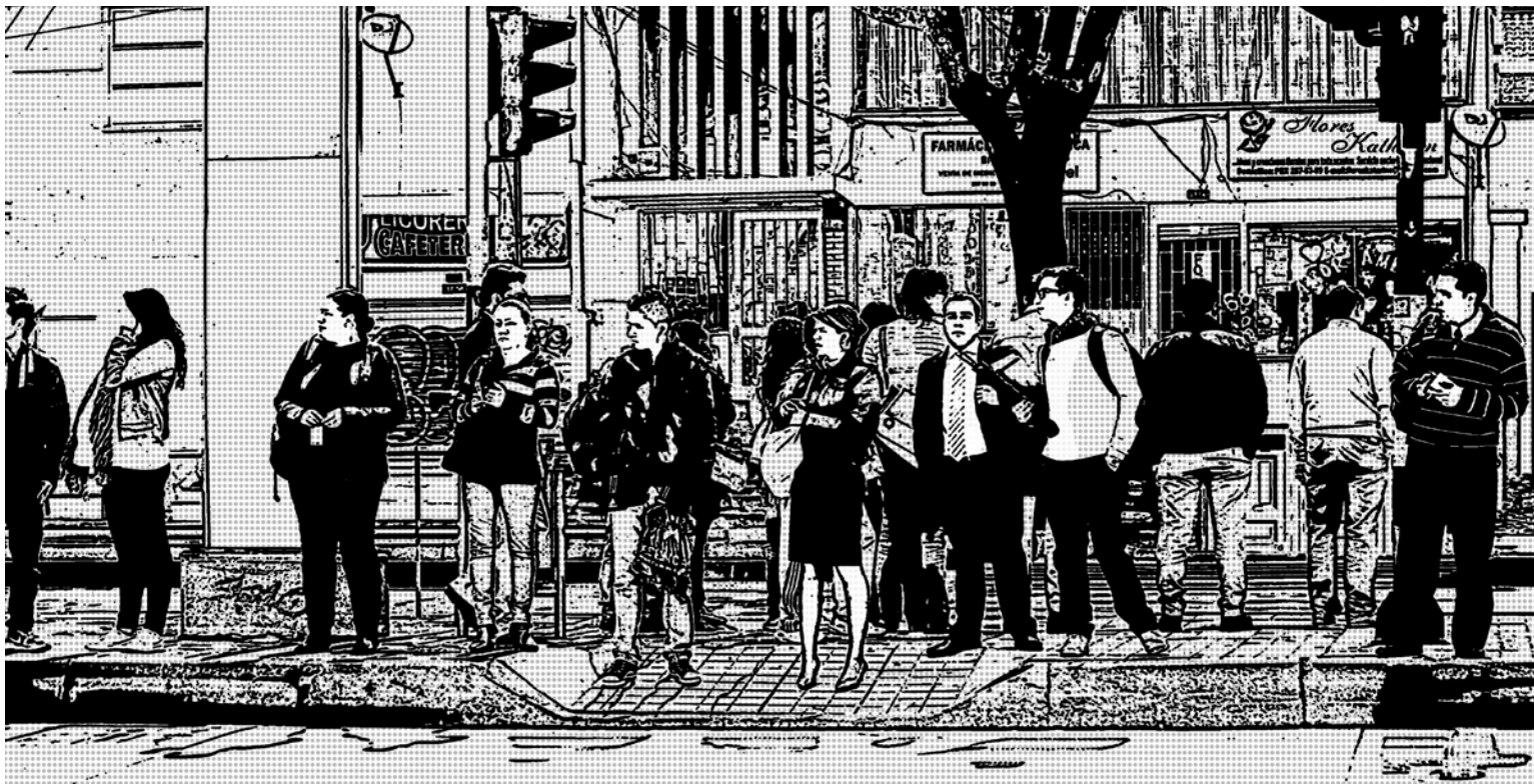
Serie En la calle 2 | FOTOGRAFÍA | DANIEL FAJARDO B.

En la fábrica, existe por encima de ellos un mecanismo muerto, al que se les incorpora como apéndices vivos. “Esa triste rutina de una tortura inacabable de trabajo, en la que se repite continuamente el mismo proceso mecánico, es como el tormento de Sísifo; la carga del trabajo rueda constantemente sobre el obrero agotado, como la roca de la fábula”. El trabajo mecánico afecta enormemente al sistema nervioso, ahoga el juego variado de los músculos y confisca toda la libre actividad física y espiritual del obrero. Hasta las medidas que tienden a facilitar el trabajo se convierten en medios de tortura, pues la máquina no libra al obrero del trabajo, sino que priva a éste de su contenido (Marx, 2001: 340 cursivas nuestras).