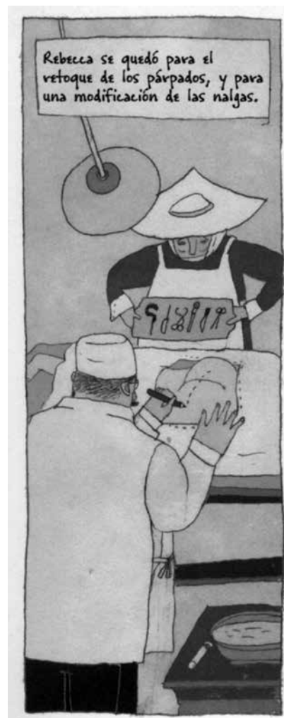
Rutu Modan | TOMADA DE JAMILI Y OTRAS HISTORIAS DE ISRAEL, EL REY DE LAS ROSAS NOVELA GRÁFICA | EDICIONES SINS SENTIDO

Para retener el oro como dinero, y, por tanto, como materia de atesoramiento, hay que impedirle que circule o se invierta como medio de compra en artículos de disfrute . El atesorador sacrifica al fetiche del oro los placeres de la carne . Abraza el evangelio de la abstención. Además, sólo puede sustraer de la circulación en forma de dinero lo que incorpora a ella en forma de mercancías. Cuanto más produce, más puede vender. La laboriosidad, el ahorro y la avaricia son, por tanto, sus virtudes cardinales , y el vender mucho y comprar poco el compendio de su ciencia económica (Marx, 2001: 91, cursivas nuestras).