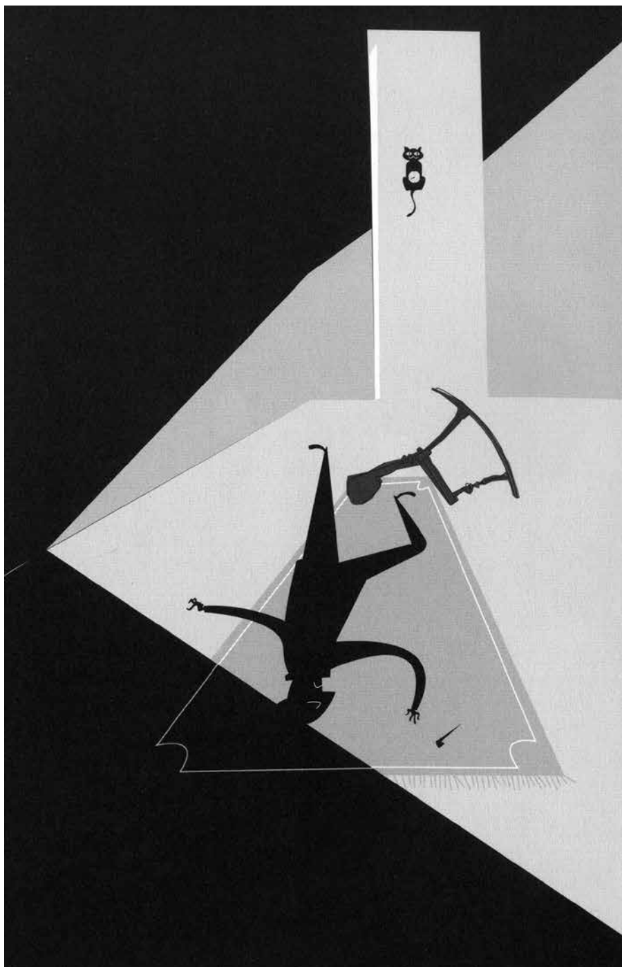
Pascal Blanchet | TOMADA DE LA FUGA , NOVELA GRÁFICA BARBARA FIORE EDITORA

Para Marx, los crueles y espantosos progresos de la muerte por hambre van a la par del desarrollo del maquinismo y la naturalización de las sensibilidades a aquéllos asociada. La crueldad es parte de una política de las emociones donde el capitalista opera desde la codicia y el egoísmo. Es obvio que las paradojas de la abstinencia en los dos escenarios de la personificación