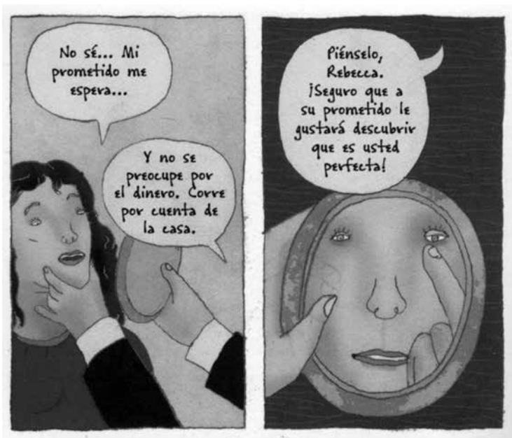
Rutu Modan | TOMADA DE JAMILI Y OTRAS HISTORIAS DE ISRAEL, EL REY DE LAS ROSAS NOVELA GRÁFICA | EDICIONES SINS SENTIDO

El poseedor de la fuerza de trabajo es un ser mortal. Por tanto, para que su presencia en el mercado sea continua, como lo requiere la transformación continua de dinero en capital, es necesario que el vendedor de la fuerza de trabajo se perpetúe, “como se perpetúa todo ser viviente, por la procreación ”. Por lo menos, habrán de reponerse por un número igual de fuerzas nuevas de trabajo las que retiran del mercado el desgaste y la muerte. La suma de los medios de vida necesarios para la producción de la fuerza de trabajo incluye, por tanto, los medios de vida de los sustitutos, es decir, de los hijos de los obreros, para que esta raza especial de poseedores de mercancías pueda perpetuarse en el mercado (Marx, 2001: 125, cursivas en el original).