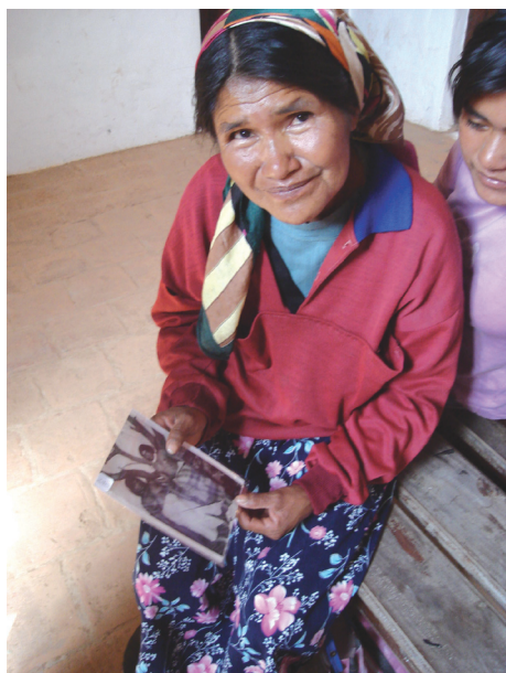
Imagen 6. Argentina, artesana wichi en una “experiencia del ver”