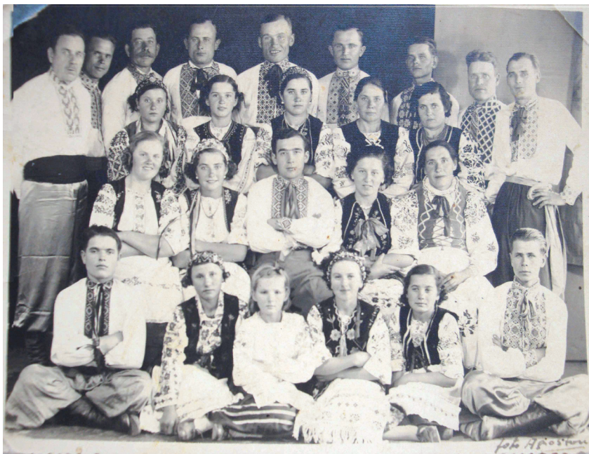
Imagen 8. Américo Agoston. “Grupo de teatro ucraniano”, 1936. Colección Nadia K. de Sasowski

El factor progresista que sentían haber impuesto al Chaco era también enfatizado al mostrar las imágenes de viviendas precarias en los primeros años de su estancia, y luego las construcciones de mayor envergadura cuando se trasladaron del campo al pueblo. Este elemento progresista también era entendido desde su rol activo en las luchas agrarias -aún cuando la imagen que mencionamos sobre una familia preparándose a asistir a una huelga obrera no muestra referentes conflictivos. Un descendiente de la familia búlgara que se encuentra en la imagen señalaba: “toda esta gente trabajó mucho, luchó mucho [...] Mirá en la foto, papá ya tenía una bicicleta, ¡vos sabés lo que es tener una bici en esa época!” 35 .