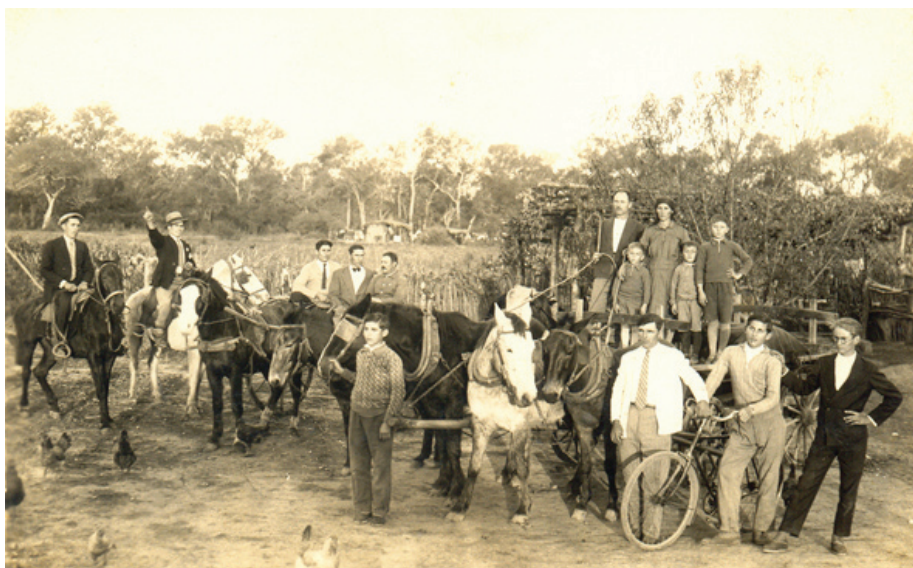
Imagen 4. Asen Georgeff. Búlgaros que se dirigen a la huelga campesina de 1936. Colección Omar Zenoff

Las distintas actividades agrícolas pero también escenas de conmemoraciones familiares, fiestas patrias -referidas a su lugar de origen-, construcciones comunales -algunas incluso donde aparece la bandera con la cruz esvástica en la Escuela alemana de Las Breñas-, o composiciones donde se preparaban para acudir a una huelga algodonera de 1936 -imagen que presenta un manejo excepcional de la técnica fotográfica realizada por el fotógrafo búlgaro Asen Georgeff-, van construyendo un modelo de relato lineal-progresista de su vida en el Chaco y también de su actitud y protagonismo en sucesos centrales de la vida económica y política chaqueña 28 . Tanto en las colecciones donde las fotografías se conservan sueltas, como en aquellas donde el álbum ha estructurado el relato, es posible advertir este interés implícito de mostrar el trabajo como símbolo del progreso, las construcciones como la materialidad del mismo y la organización cooperativa o la lucha gremial como sustento de sus aspiraciones.