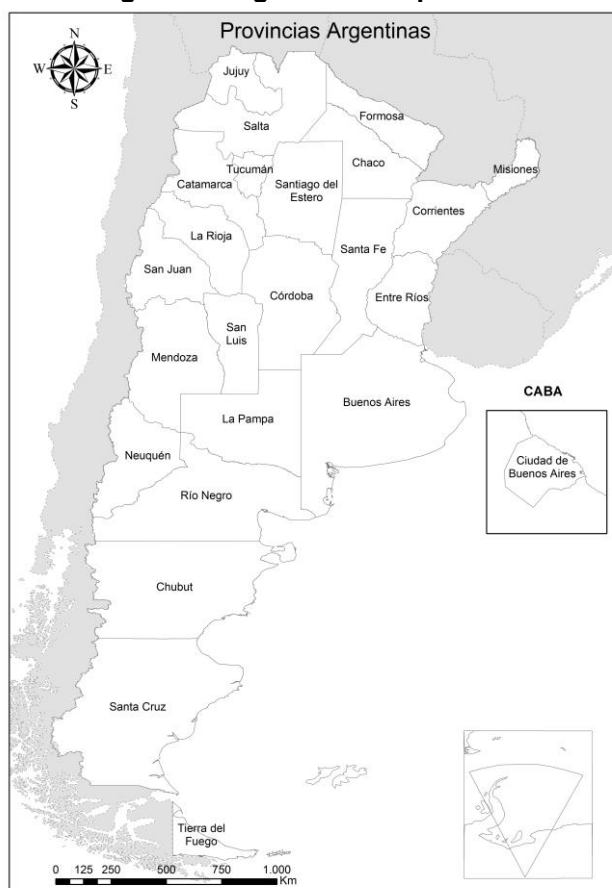
Figura 1. República Argentina según división político-territorial (provincias)

El reciente boom de la minería metálica en la Argentina, con epicentro en las provincias de Catamarca, San Juan y Santa Cruz (Figura 1), se ha basado en la implementación de numerosas formas o mecanismos de acumulación por desposesión.