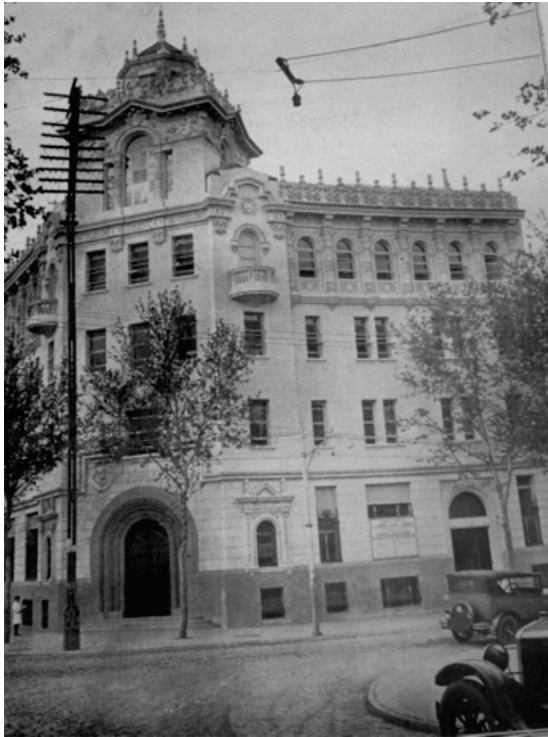
FIGURA 2. Mercantil Andina, Mendoza. Daniel Ramos Correas, Arq. 1928.

Es así que allí donde algunos autores observan lo neocolonial como un “recubrimiento” de la forma, nosotros interpretamos que su repertorio decorativo fue importante como vehículo y expresión del modernismo nacionalista latinoamericano y que formó una totalidad indisoluble con los demás problemas arquitectónicos, planta, volúmenes, materiales, etc.; es decir, tuvo su razón de ser y estuvo culturalmente justificado.