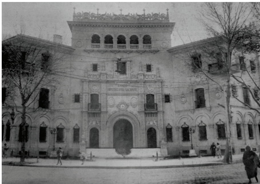
FIGURA 1. Banco Hipotecario Nacional. Estanislao Pirovano Arq. 1928.

Es por estas consideraciones que entendemos que la apariencia externa, entre ellas la decoración, responde y expresa asuntos que no tienen que ver solo con la propia forma, sino que están ligados al plano de lo cultural. Lo fenoménico es la manifestación final de un proceso de creación artística del individuo o del grupo y es significativo de un compromiso y una decisión existencial. 24 Concordamos con Antal acerca de la imposibilidad de entender la historia del arte como historia de los estilos sin conexión con otros problemas históricos. Por ello, consideramos los productos formales como elementos significativos cuya importancia trasciende lo meramente material y se arraiga en procesos sociales, políticos y simbólicos con los que están profundamente relacionados. 25 Macherey afirma que una obra: “[...] existe sobre todo por sus ausencias, por aquello que no dice, por su relación con lo que no es ella.” 26 Ello nos conduce a pensar que