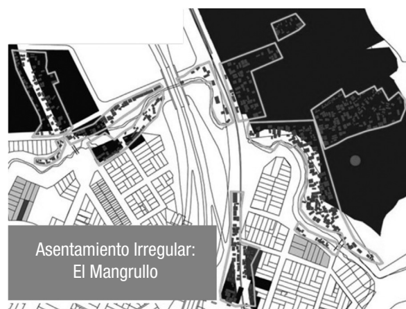
Figura 4. Asentamiento irregular El Mangrullo