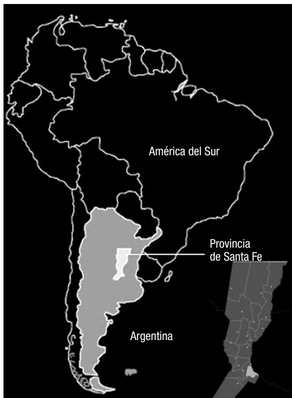
Figura 1. Ubicación AMR, Santa Fe, Argentina

a una disminución de la calidad de vida de la población. A partir de la década del noventa, se evidencia la aceleración del proceso de marginación como también de exclusión social de amplios sectores de la sociedad, manifestándose en el incremento de población que pasa a vivir en los denominados “asentamientos irregulares”. En lugar de reducirse, esta modalidad de ocupación se incrementa cada año, caracterizándose por la situación conflictiva en relación con el uso del suelo y con la propiedad de la tierra y las deplorables condiciones de hábitat. Como se explicó, en la mayoría de las localidades de esta franja costera se manifiesta el progresivo aumento del número de habitantes residentes, tratándose no solo de expansión o densificación de asentamientos existentes, sino también del surgimiento de nuevos, marcados siempre por graves condiciones