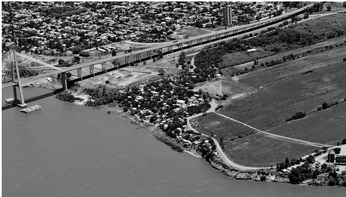
Figura 3. Asentamiento irregular Remanso Valerio