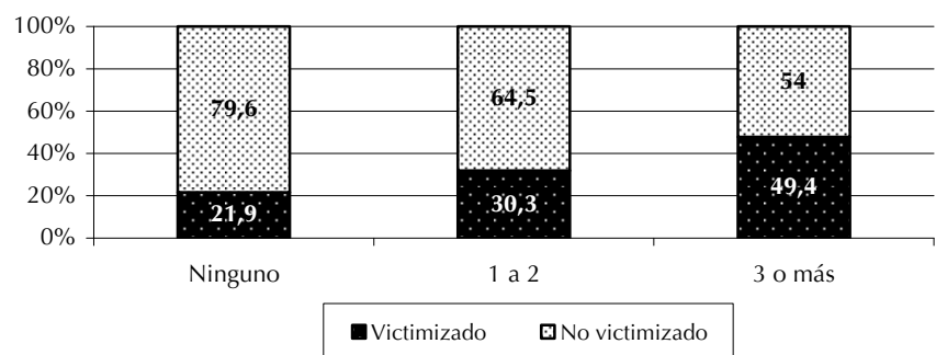
Figura 2. Victimizados según la extensión del conflicto vecinal (Encuesta propia).

La Figura 2 muestra que, mientras sólo el 21,9% de los que no tienen conflictos han sido victimizados por algún tipo de delito, entre el 30 y casi el 50% de quienes sí los tienen han sufrido delitos. En este caso, la significación estadística ( p < 0,0001 ) permite descartar la hipótesis nula. Esto implica que, en promedio, el riesgo relativo