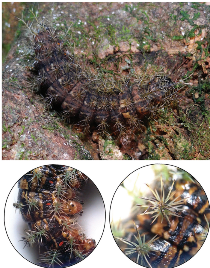
Fig. 1.— Larva de Lonomia obliqua en estadio 6. Nótese en la foto superior los colores y el patrón cromático de la oruga que le permiten mimetizarse con el entorno en el que se encuentra. En las fotos de la porción inferior se observan en detalle las cerdas en forma de ramificaciones conspicuas cuyo interior contiene el veneno.

cuerpo se quiebran y las toxinas de su interior ingresan pasivamente a través de la lesión, generando dolor local intenso tipo quemante, junto con eritema y prurito. De ahí que comúnmente se conozcan a estas orugas como “taturanas” (del guaraní “semejante a fuego”) 3 . Una vez dentro del organismo, las toxinas de L. obliqua , además de los efectos netamente inflamatorios, activan factores de coagulación y de fibrinólisis, desencadenando un desequilibrio hemostático que se traduce en hemorragias que suelen aparecer entre las 8 y 72 horas de producido el accidente. Éstas incluyen equimosis en el sitio de contacto, hemorragia gingival, epistaxis, hematuria, hemorragia digestiva y en casos graves hemorragia en órganos vitales 3-5 . Los exámenes de laboratorio muestran una gama de alteraciones, siendo común encontrar la prolongación de los tiempos de protrombina (TP), de trombina (TT), y de tromboplastina parcial activada (KPTT), entre otras 6 .