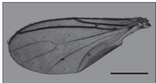
Fig. 1. Bradysia aliciae sp. nov. Ala izquierda. (Escala = 0,5 mm).

Derivación del epíteto específico. Dedicado a Alicia Viturro.