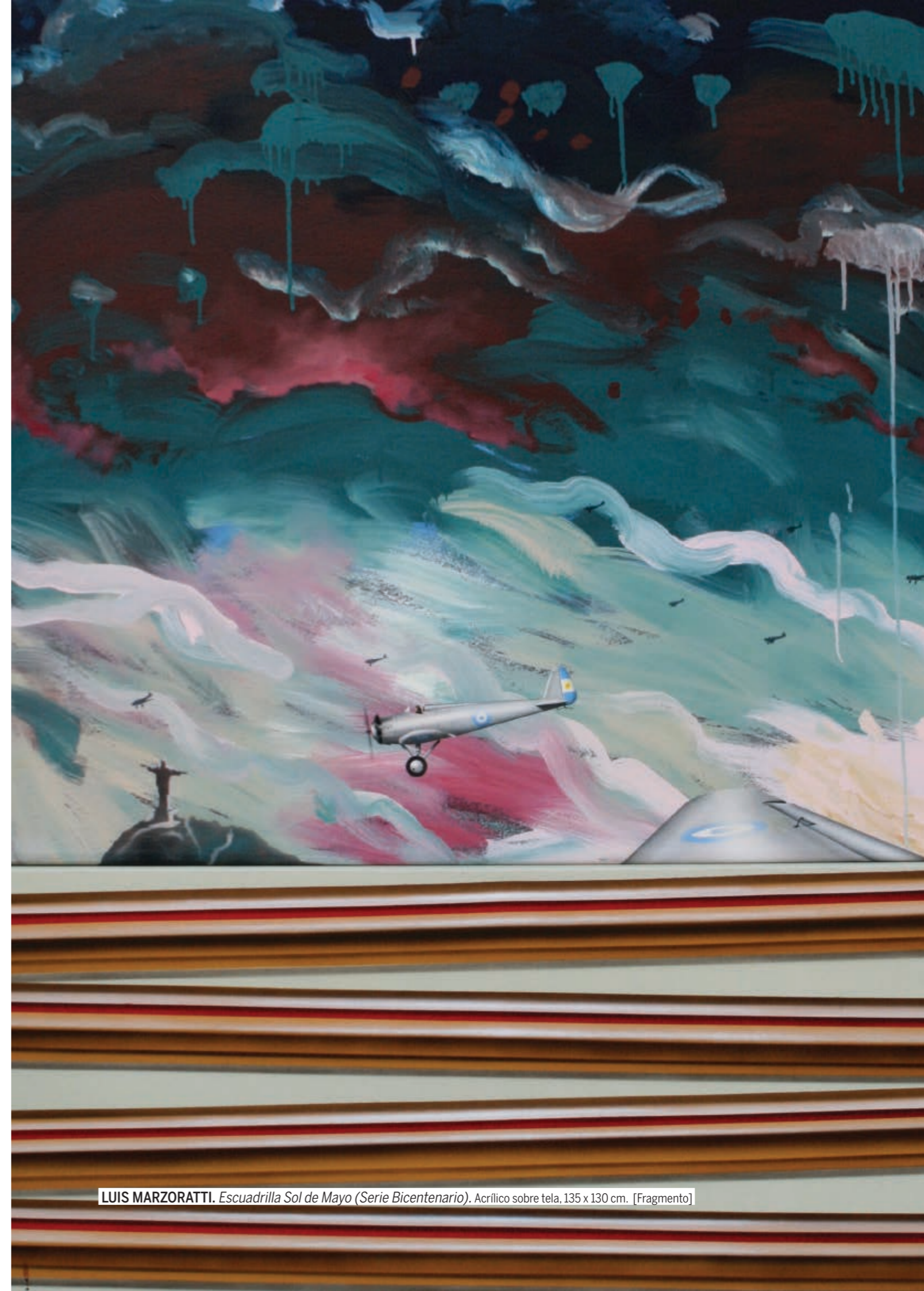
LUIS MARZORATTI. Escuadrilla Sol de Mayo (Serie Bicentenario). Acrílico sobre tela, 135 x 130 cm. [Fragmento]

VITELLI, M. (2011). "Hacia una identidad sudamericana de defensa: contrastes entre el Sistema Interamericano y el Consejo de Defensa de la UNASUR", en Revista Densidades N° 6, Buenos Aires: Densidades.