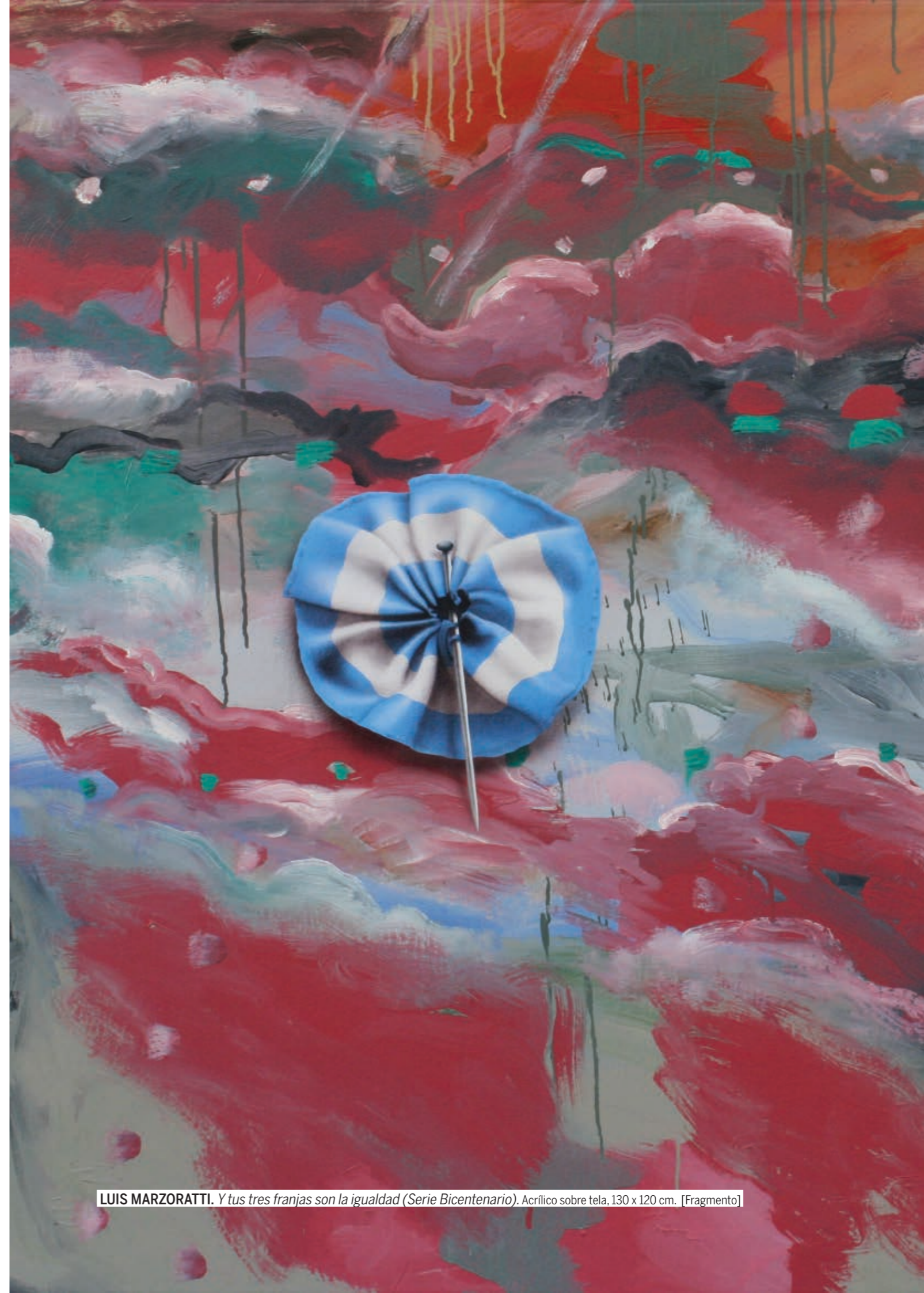
LUIS MARZORATTI. Y tus tres franjas son la igualdad (Serie Bicentenario). Acrílico sobre tela, 130 x 120 cm. [Fragmento]

VÁZQUEZ GARCÍA, Humberto. De Chapultepec a la OEA: apogeo y crisis del panamericanismo. La Habana: Editorial de Ciencias Sociales, 2001.