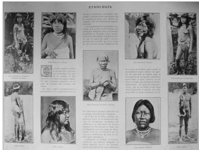
2. Álbum «1810-1910. La República Argentina en el Primer Centenario de su Independencia». Buenos Aires, Imprenta Rosso, 1910.