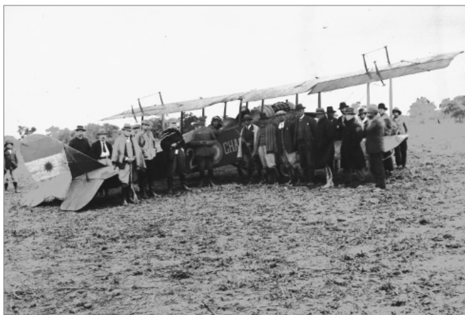
4. 37. «Avión contra levantamiento indígena», 1924.