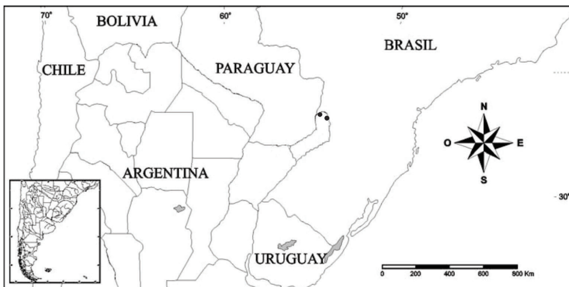
Fig. 3. Distribución de Lindsaea quadrangularis subsp. terminalis en Argentina. ● = localidades de presencia de la especie.