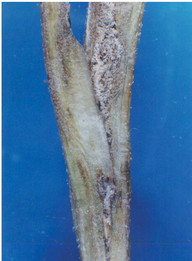
Figura 1. Daño de Melanagromyza cunctanoides en tallo de girasol.