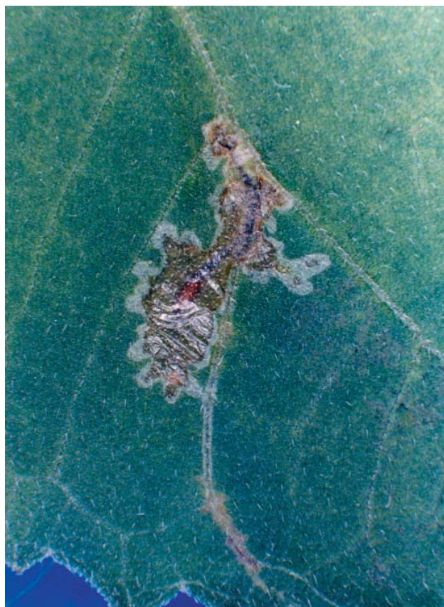
Figura 3. Mina de Nemorimyza maculosa en hoja de crisantemo.