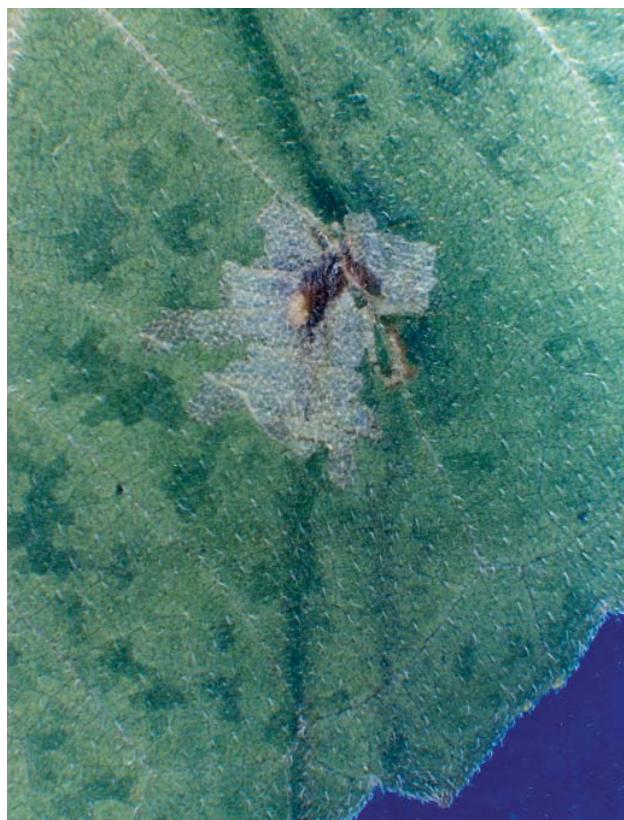
Figura 4. Mina de Calycomyza platyptera en hoja de girasol.