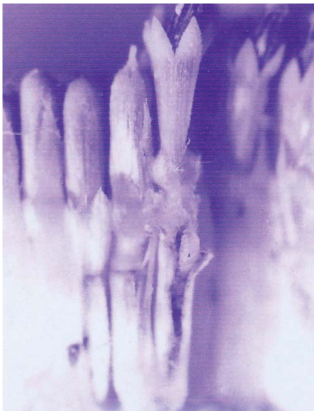
Figura 2. Daño por Melanagromyza minimoides en inflorescencia de girasol.