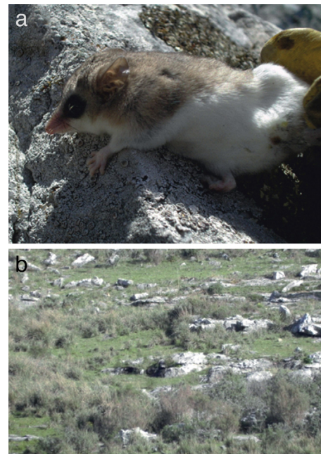
Figura 2. Foto de Thylamys sp. (a) y del sitio de captura (b) en sierra de Los Padres, Partido de General Pueyrredón, provincia de Buenos Aires, Argentina.

Como parte de un relevo faunístico realizado en el sistema serrano de Tandilia (fig. 1), particularmente en sierra de los Padres (Partido de General Pueyrredón, provincia de Buenos Aires, Argentina), registramos un individuo de Thylamys sp. en abril de 2014 (fig. 2a). El mismo fue capturado a mano aproximadamente a las 13:30 h cuando se encontraba inactivo debajo de una roca rodeada por matas de Stipa sp. y Paspalum quadrifarium (fig. 2b), en un punto situado sobre la ladera de una formación serrana en la estancia «El Abrojo» (37°55'37" S;