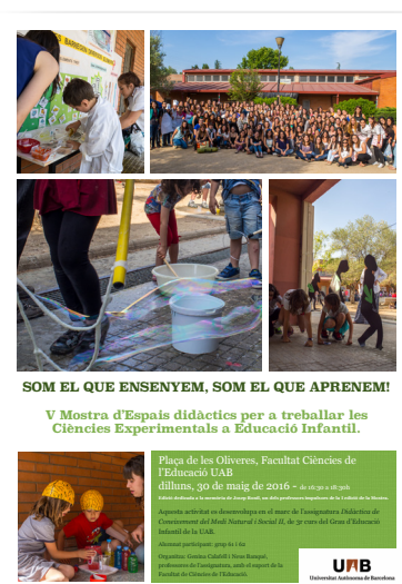
Fig. 1. Cartel de la Feria de Ciencias

Las instituciones universitarias y formación inicial de maestros son un buen espacio para investigar e avanzar en la ambientalización. Con esta premisa desde el Grado de Maestros de especialidad en EI y desde la asignatura DCMNS-II se organiza desde el curso 2011-2012 la Feria de Ciencias (Figura 1). En ella el alumnado muestra a la comunidad universitaria y a las familias del centro educativo próximo a la facultad las actividades de EC diseñadas en el marco de la asignatura.