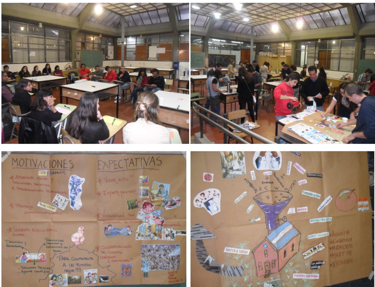
Figura 2: Proceso participativo en la elaboración del libro del INENCO. Taller de becarios 2013. Ejemplos del trabajo grupal: Motivaciones y expectativas.

conocimiento mutuo. Destáquese la creatividad y profundidad de los trabajos realizados para expresar las visiones y percepciones de los más jóvenes (Figura 2). El compromiso y la participación de la mayoría de los integrantes del instituto en las diversas instancias, posibilitaron contar con un material de base completo y diverso para la redacción del libro.