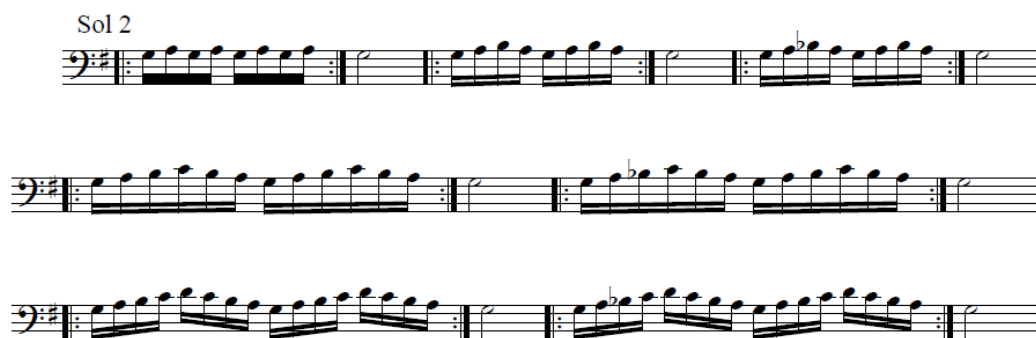
Ilustração 14 – Exercícios de Coordenação Sol 2

O exercício de coordenação Sol 2 foi executado à semínima e cada secção foi executada em staccato e legato . Tal como já tinha sido evidenciado, o aluno não utiliza o metrónomo, mesmo depois de muita insistência nas aulas por parte da professora para que o aluno o utilize no seu estudo diário. Neste exercício, embora o aluno não utilize metrónomo, conseguiu atingir os objetivos, executando o exercício técnico com segurança e destreza. Desse modo, o aluno não precisou de repetir o exercício na aula.