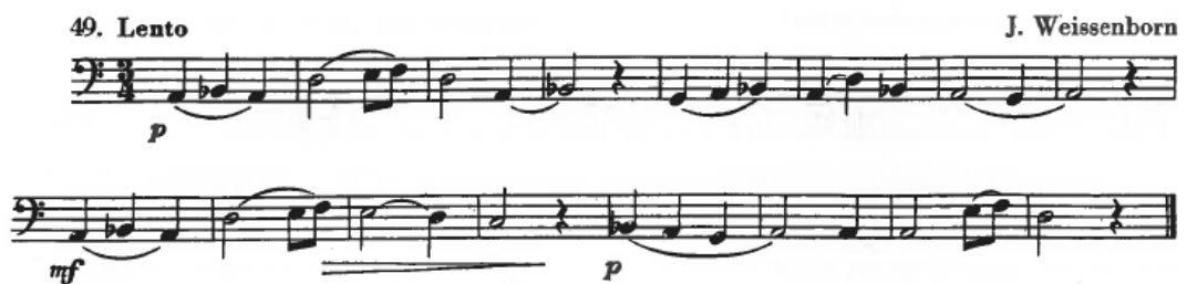
Ilustração 6 – Estudo 49 do método de “Hara”

O estudo nº 49 do Método de “Hara” foi executado, tal como no exercício anterior, sem metrónomo. Neste exercício, o aluno revelou alguns erros rítmicos. Na aula, foi pedido ao aluno que solfejasse o estudo com batimento da pulsação e marcasse na partitura as suas dificuldades. Assim, o aluno conseguiu identificar quais os erros que efetuou na gravação e no seu estudo. Posteriormente, o aluno tocou o estudo com recurso ao metrónomo, executando mais de uma vez o estudo até ter corrigido os seus erros.