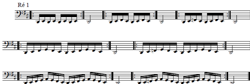
Ilustração 3 – Exercícios de Coordenação Ré 1

Na aula, solicitou-se ao aluno que tentasse soprar mais e com mais emissão do ar e apoio para melhorar a execução do exercício.