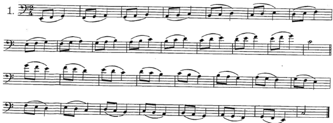
Ilustração 16 – Exercícios Técnico Giampieri 1

A tarefa 4 foi planejada para o mês de Fevereiro e foi enviada para a professora no dia 22.02.2016, uma segunda-feira. O prazo de envio não foi cumprido mas a tarefa foi aceite. A tarefa 4 consistia na gravação do exercício técnico 1 (pág. 7) do método progressivo de Giampieri. Na gravação, o aluno executou bem o exercício solicitado. Como a tarefa foi realizada com sucesso, a professora não pediu ao aluno para repetir na aula.