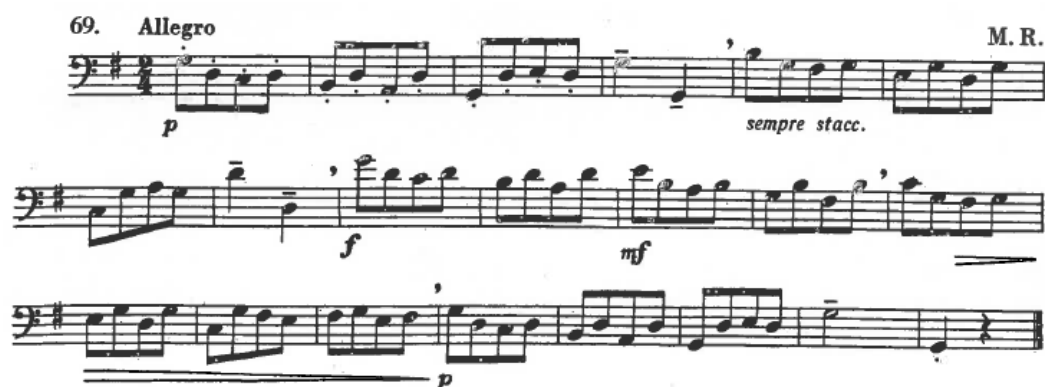
Ilustração 12 – Estudo 69 do método de “Hara”

O aluno realizou várias gravações do estudo, tentando corrigir os seus erros através da audição das mesmas. Ao todo gravou 12 versões do estudo. Na última versão, o aluno executou o estudo quase sem nenhuma falha, com bom som e o ritmo correto.