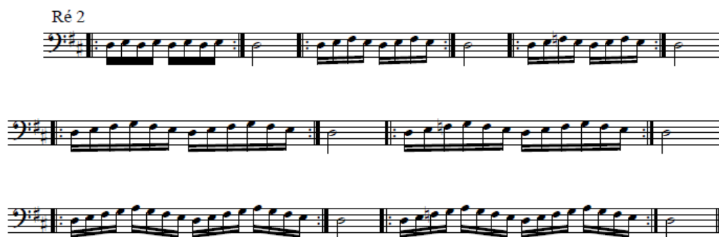
Ilustração 13 – Exercícios de Coordenação Ré 2

O aluno deveria ter utilizado o metrónomo no seu estudo. Embora não o tenha utilizado, conseguiu manter um tempo consistente e à semínima. O aluno executou cada secção do exercício, primariamente, em staccato e na repetição em legato , tal como a professora tinha pedido na aula anterior. Executou o exercício com um bom som e uma boa emissão de ar. Como a tarefa foi bem realizada, o aluno não teve que repetir o exercício de coordenação Ré 2 na aula.