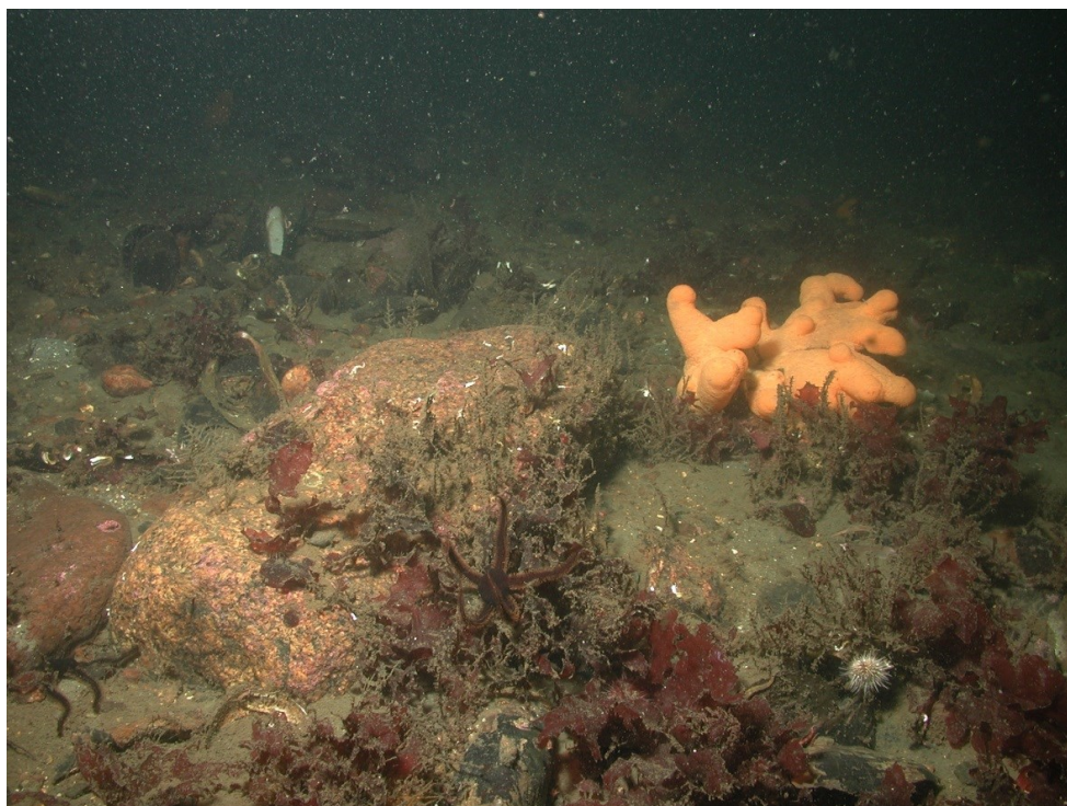
Figur 3. Kombineret rev bestående af både sten og hestemuslinger på Schultz's Grund på 17,5m dybde. På billedet kan se både blødkorallen dødningehånd ( Alcyonium digitatum ), sort slangestjerne ( Ophiocoma nigra ) grønt søpindsvin ( Strongylocentrotus droebachiensis ). Trekantsorm ( Spirobranchus triqueter ) kan ses som hvide elementer på stenene og forskellige hydroider bla. Granpolyp ( Abietinaria abietina ) der kan kendes som den bredt fjergrenede hydroid på den store sten. Rødalgen bugtet ribbeblad ( Phycodrys rubens ) vokser her både på sten og især på hestemuslinger som er skjult under algen. Hestemuslingerne ses i forgrunden og baggrunden af billedet.

Et eksempel på et kombinerede rev af sten og hestemuslinger: På Schultz's Grund på 17,5 m dybde blev der fundet et kombineret rev. Revet består af spredte mindre banker med spredte større sten på en groft gruset bund, hvori der findes hestemuslinger. I 2015 blev bundforholdene af dykkeren beskrevet som 20% sten samt 5% levende hestemuslinger og en del skaller. Bankens samlede areal kan ikke opgøres ud fra de årlige gennemførte dykninger, der hver især ca. dækker et areal på 100 m 2 . Biologiske komponenter knyttet til hestemuslingesamfundet kan ses i figur 2 samt forside billedet. Figur 3 viser biologiske komponenter knyttet til en rev med en kombineret hestemuslinger og stenbund.