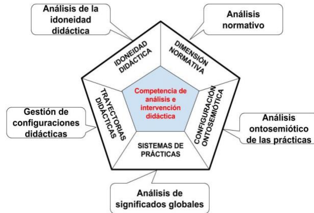
Figura 2. Componentes de la competencia de análisis e intervención didáctica (Godino et al., 2017, p. 103)