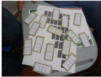
Figura 7. Dominó de operaciones aritméticas.