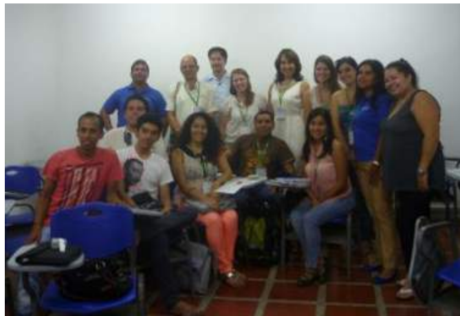
Figura 10. Cierre del taller.

Queremos cerrar este trabajo rescatando la felicidad percibida en los asistentes al taller cuando vieron plasmada su obra, pudieron compartirla con otros, ponerla a consideración y llevársela para trabajar con sus alumnos de secundaria (Fig. 10).