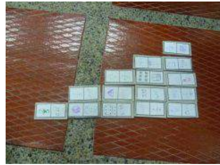
Figura 8. Dominó de fracciones.