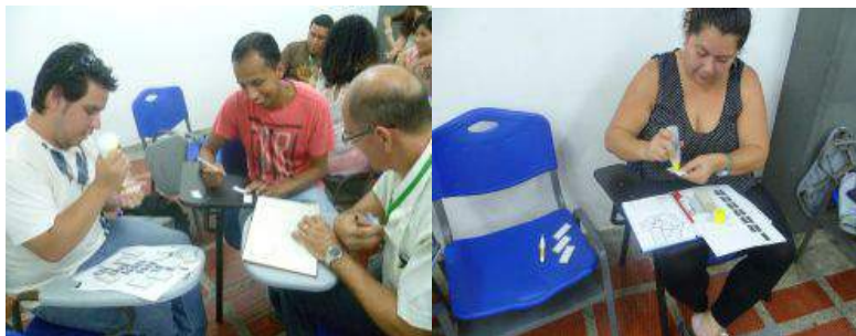
Figura 3. Asistentes al taller en proceso de elaboración de sus dominós matemáticos.

Al final de la sesión se realizó una puesta en común en la que cada grupo realizó un breve comentario acerca del contenido matemático elegido para la construcción de su dominó, mostró el diseño de las fichas y propuso en qué año y/o nivel podría desarrollarse una propuesta de enseñanza que involucre el uso del mismo.