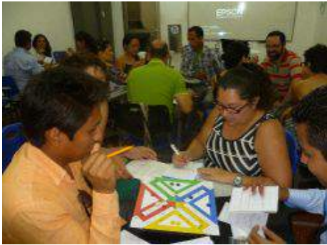
Figura 1. Asistentes al taller jugando al ludo matemático.