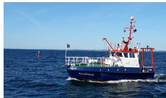
Abbildung 4: Besuch der Polarfuchs mit dem Drifter im Hintergrund.

Vielen Dank auch an die gesamte Crew der Alkor, mit der die Zusammenarbeit hervorragend klappt. Die Stimmung an Bord ist trotz des hohen Arbeitspensums super, woran auch das gute Wetter seinen Anteil hat, sodass erst eine Schlauchbootfahrt aufgrund stärkeren Seegangs ausfallen musste.