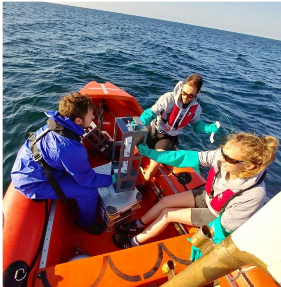
Abbildung 3: Beprobung der SML auf dem Schlauchboot.

Nach den ersten paar Tagen ist bei unseren Abläufen inzwischen Routine eingeleitet. Neben den stündlichen Underwaymessungen von z.B. DMS oder Isoprenen und den kontinuierlichen Messungen von SF 6 , sowie Temperatur, Salzgehalt, chl-a und CDOM gehen wir täglich um 06:00 und 18:00 Uhr für circa 3-4 h, soweit möglich, in der Mitte des Tracer-Patches auf Station und fahren ein CTD-Profil. Die