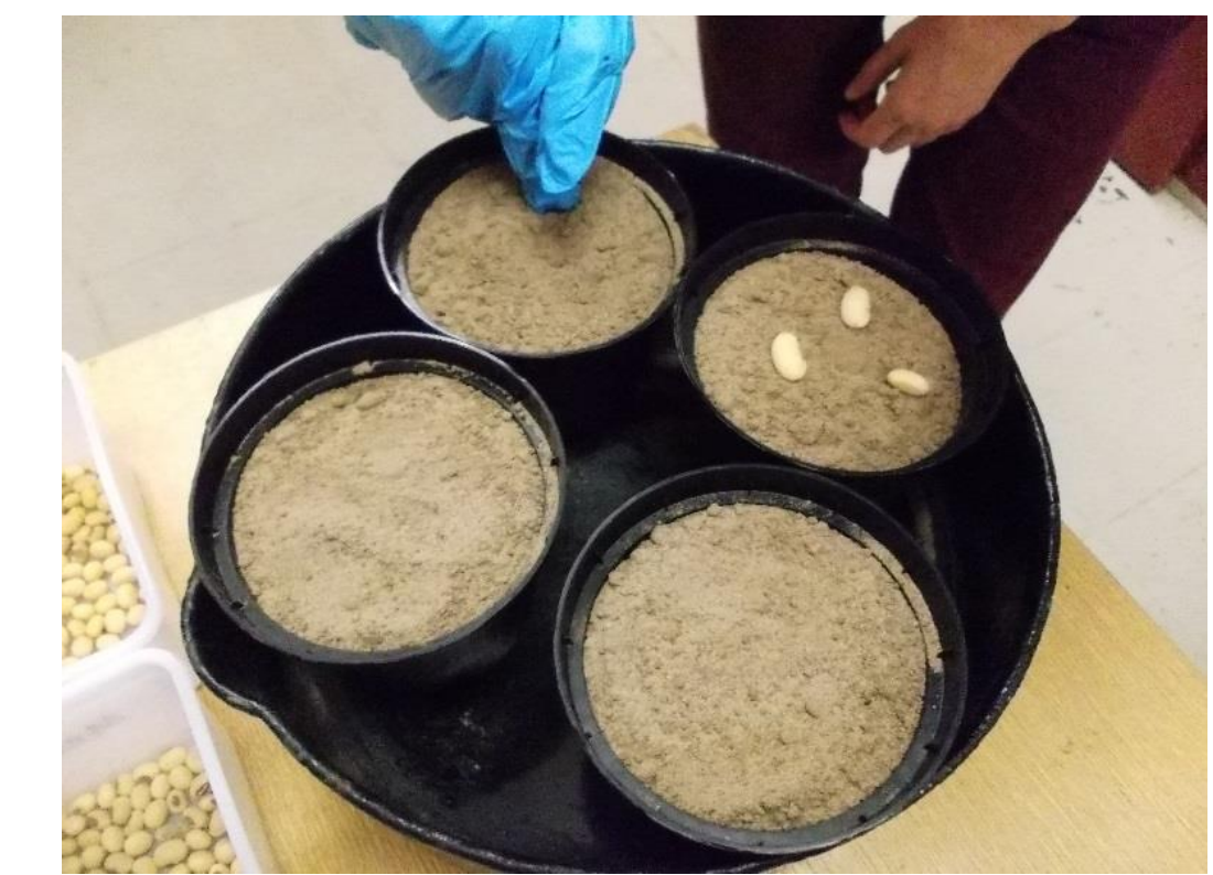
Abb. 4: Ablage der Bohnen im Gefäßversuch