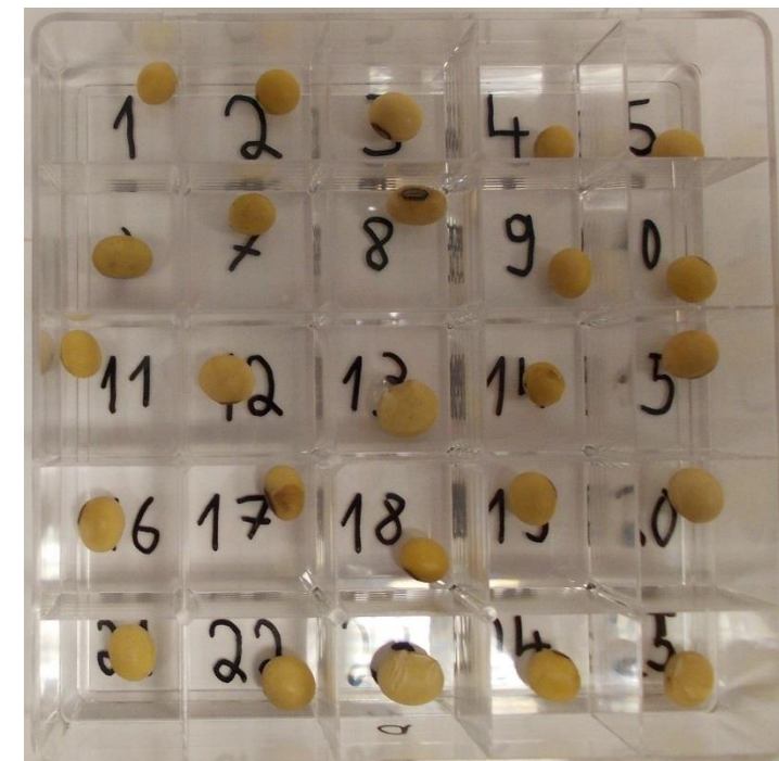
Abb. 2: Priming einzelner Bohnen