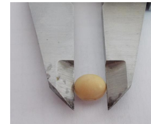
Abb. 3: Messen der Bohnen

Gefäßversuch zur Untersuchung der Keimfähigkeit und Keimdauer: