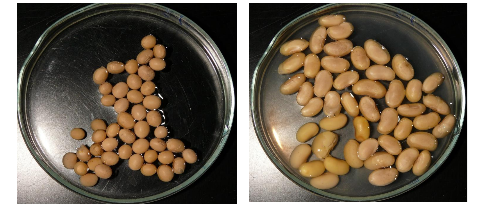
Abb. 1: Vor und nach dem Priming (12 h, Sorte Lissabon)

Untersuchung der Wasseraufnahme- und Größenzunahme: