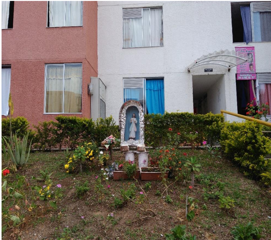
Evidencia 002: Semantización de los espacios (Marzo 2017)