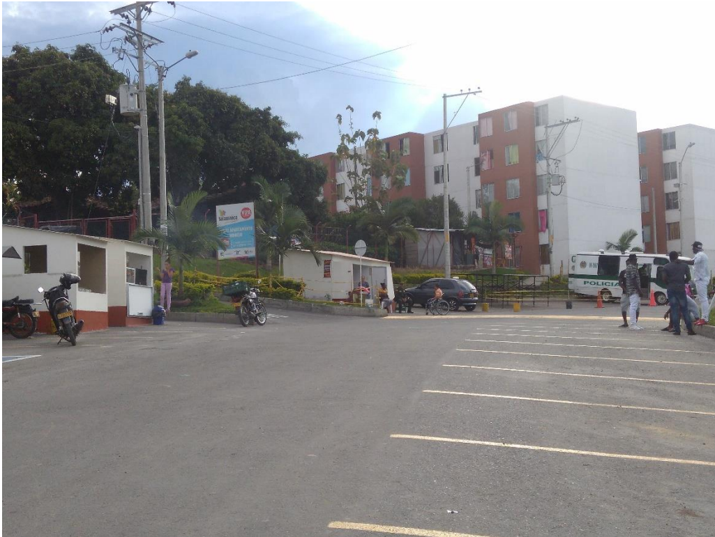
Evidencia 006: Uso de la zona de parqueo para actividades comerciales (Quioscos de venta, lado izquierdo de la fotografía) (Marzo 2017)