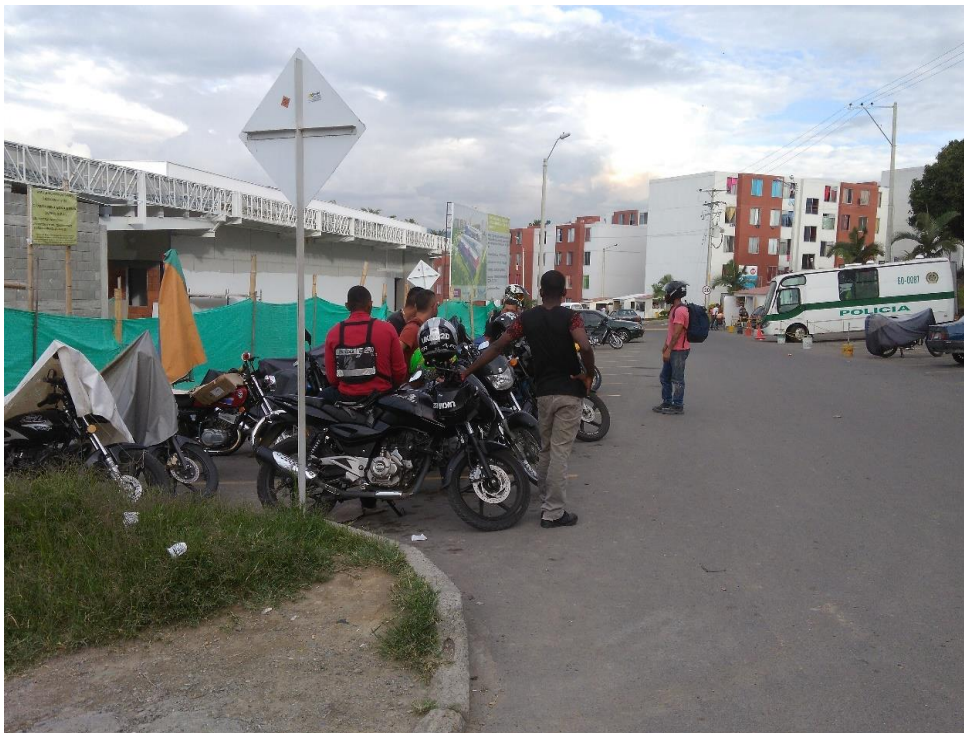
Evidencia 005: Mototaxistas ubicados en la vía principal (Marzo 2017)