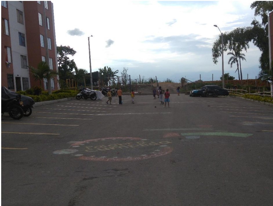
Evidencia 004: Uso de vía principal para actividades recreativas (Marzo 2017)