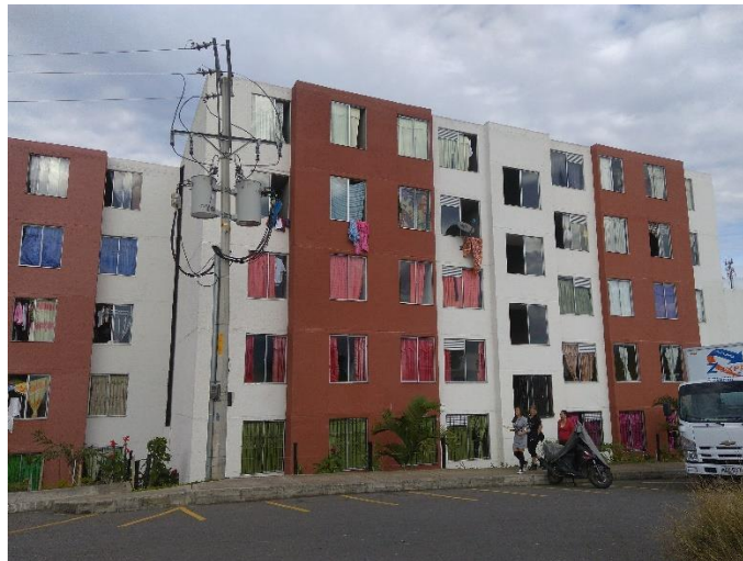
Secado de ropa en ventanas de apartamentos.

Como en el caso de los tendedores de ropa, aquí nuevamente se muestra la vivienda como una limitante que obliga a los habitantes a resignificar sus antiguas prácticas puesto que al no tener espacios idóneos al interior de las viviendas para secar la ropa, algunos optan por ponerla en las ventanas, lo que violenta una de las normas que se estableció desde el inicio. La informante cuatro afirma que no está permitido poner ropa en las ventanas, esta regla fue determinada al momento de otorgarle el apartamento a los beneficiarios, pero ellos han debido transgredirla y esto ha generado malestar entre la comunidad, ya que hay quienes dicen que no es estético y otros que afirman no tener más opción.