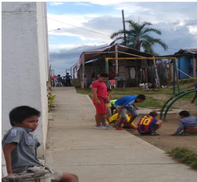
Evidencia 003: Autoconstrucción de caseta comunal en guadua (Marzo 2017).