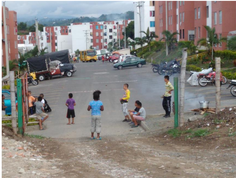
Distribución espacial de Salamanca