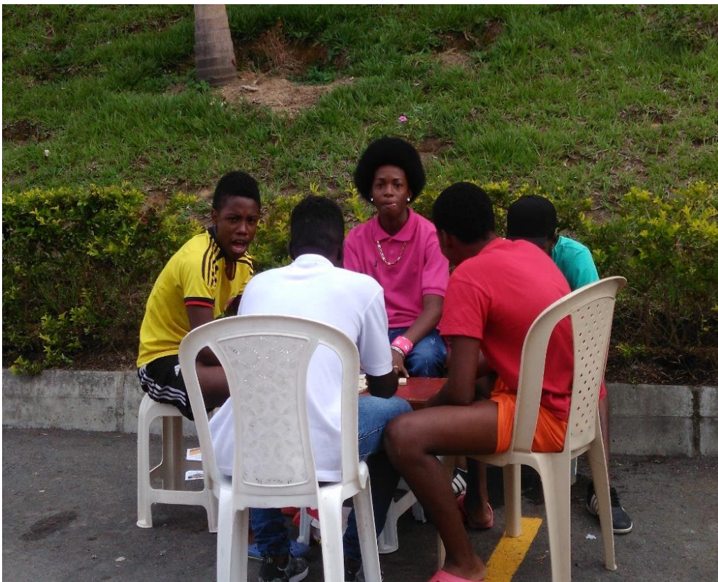
Evidencia 001: Apropiación de espacio de parqueo para uso recreativo (Marzo 2017).