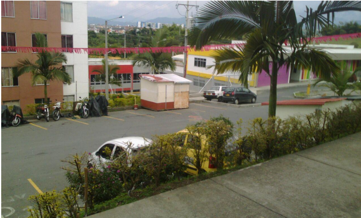
Evidencia 008: En la parte derecha al fondo, el colegio del barrio Salamanca (Abril 2017)