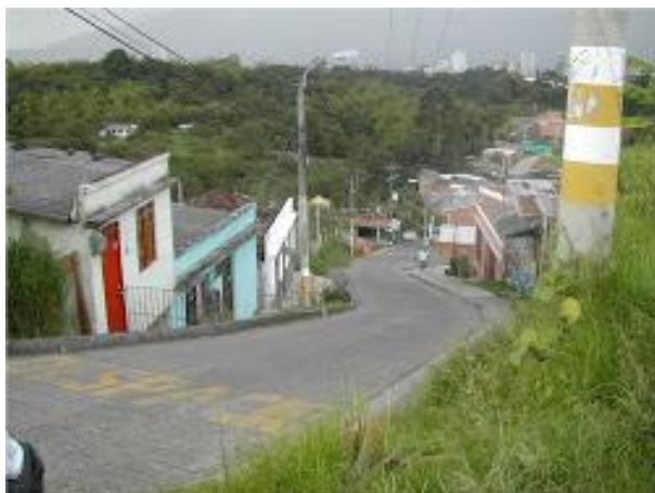
Fotografía 16 Vía de acceso al barrio El Bosque (Prieto, 1986)

conjunto de sentimientos, percepciones, deseos, necesidades, construido sobre las bases de las prácticas y actividades desarrolladas en los espacios cotidianos. (Ortiz, 2006, pág. 70)