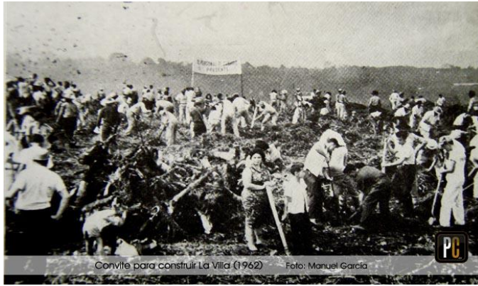
Fotografía 7 Construcción de la Villa Olímpica 1962 (García, 1962)

Otro factor a tener en cuenta, es que los espacios públicos hoy en día pasan por distintos fenómenos que hacen que las características de la vida cotidiana actual de la ciudad repercutan en ellos. Entre las que están las nuevas formas de comunicación, como la comunicación virtual y variados tipos de ocio que la tecnología ofrece como los videojuegos, el internet y los teléfonos inteligentes, entre otros; además, existen otros factores que influyen para que se lleve a cabo la apropiación e interacción en estos espacios, como lo son las grandes distancias a recorrer en la ciudad y una vida ocupada, reducen el tiempo para la recreación, así como el descuido, la falta, y en algunos casos la inexistencia de espacios públicos cercanos a las zonas donde se habita. (Correa, 2007, pág. 9)