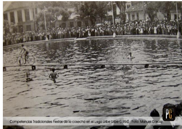
Fotografía 5 Diciembre 1954-Lago Uribe (García, 1954)

En este caso en particular, la búsqueda incansable de tener una ciudad que combine la interacción social con la crudeza de la diferencia, han llevado a que los sujetos según su naturaleza y comportamiento particular hagan de los espacios públicos la mejor plataforma de interacción social. De ahí, que el parque el lago ya desde los años 30, se convirtiera en el punto de encuentro para propios y extraños. (Méndez Mulet & Velásquez Velásquez, 2009, pág. 77)