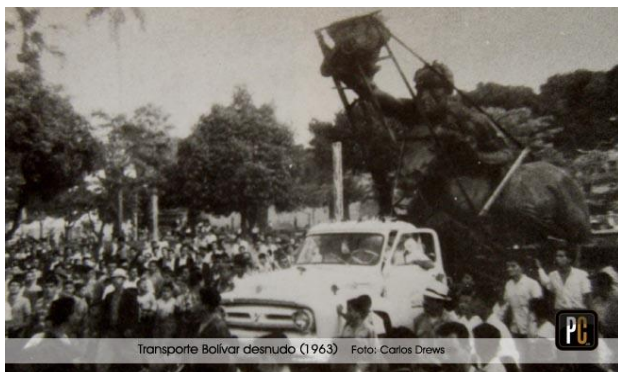
Fotografía 1 La ciudadanía sale al recibimiento del nuevo icono de la ciudad “Bolívar Desnudo” (Drews, 1963)

Con lo anterior, podemos afirmar que la historia de una ciudad es la que se entreteteje en su espacio público, lugar donde se dan las relaciones entre los habitantes, como entre el poder y la ciudadanía, los cuales se materializan y se expresan en la conformación de las calles, las plazas, los parques, entre otros. (Becerril, 2016, pág. 171)