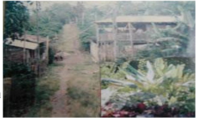
Fotografía 12 Las fincas donde se construyó el barrio El Bosque (Prieto, 1986)

Bajo esta visión, el desarrollo del departamento de Risaralda, fue por muchos años producto de la actividad agrícola del café. Las familias en buena parte cubrieron todas sus necesidades básicas (alimentación, vivienda, salud, entre otras) gracias a esto, logrando que la región también se viera beneficiada, lo cual trajo consigo prosperidad, productividad, industria y comercio. Pero no todo el tiempo ha sido así, con la caída del café en el año 1997, se produjo una pérdida notable de los niveles de desarrollo, asociada con la caída del PIB, lo que fracturó visiblemente la economía municipal, dejando como resultado una profunda crisis cafetera, la cual, influyó en los precios del suelo, produciendo una venta masiva de los mismos. (MURILLO, 2008)