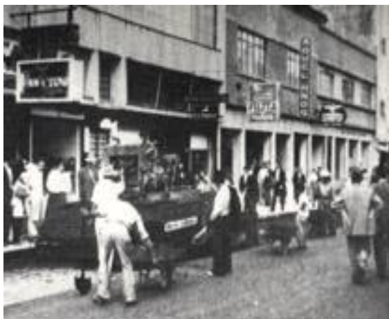
Fotografía 3 Pavimentación de la carrera 8a. Septiembre de 1954. (Garcia, 1954)

De manera que, el espacio público supone un dominio público, un uso social colectivo e individual con multifuncionalidad, que se caracteriza físicamente por su accesibilidad, lo que lo hace un factor de centralidad (Borja & Muxi, El espacio publico, ciudad y ciudadania, 2001). El cual puede ser definido y categorizado desde el aspecto legal, político, ambiental, cultural, etc., y puede estar sujeto a distintas normas y a su vez, representar usos distintos o específicos, debido a que, los espacios públicos funcionan como una plataforma para la creación de la identidad colectiva de una sociedad. (Peyloubet, 2006, pág. 11).