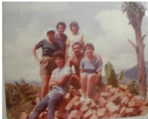
Fotografía 13 Construcción de las Viviendas (Prieto, 1986)

Bajo esta visión, el desarrollo del departamento de Risaralda, fue por muchos años producto de la actividad agrícola del café. Las familias en buena parte cubrieron todas sus necesidades básicas (alimentación, vivienda, salud, entre otras) gracias a esto, logrando que la región también se viera beneficiada, lo cual trajo consigo prosperidad, productividad, industria y comercio. Pero no todo el tiempo ha sido así, con la caída del café en el año 1997, se produjo una pérdida notable de los niveles de desarrollo, asociada con la caída del PIB, lo que fracturó visiblemente la economía municipal, dejando como resultado una profunda crisis cafetera, la cual, influyó en los precios del suelo, produciendo una venta masiva de los mismos. (MURILLO, 2008)