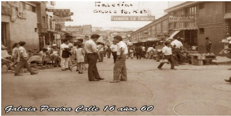
Fotografía 6 Galería Pereira (Desconocido, 1960)

Lo que lleva, a que la vivencia de lo urbano sea un proceso que se estructura a partir de la interrelación, haciendo que la presencia del espacio público se convierta en un medio de expresión, de un escenario de referencia y una posibilidad de articulación creativa, convirtiéndolo en el eje articulador entre el hombre y el entorno, en donde las manifestaciones de dicha relación permiten construir una visión de la realidad y de las necesidades de cada individuo, como un espacio de materialización, explicado así en el Plan Maestro de Espacio Público: