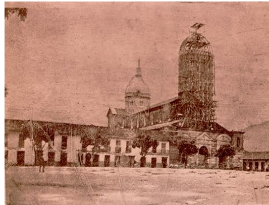
Fotografía 4 Catedral Nuestra Señora de la Pobreza. (Andrade F. d., 1906)

luego comenzó a ser sustituida por ladrillos, tapias y hormigón, para llegar finalmente a la era del cemento y con ello la transformación del paisaje urbano (la pavimentación de calles, plazas y la construcción en cemento de los primeros edificios). Pasado y presente en una fusión, hacen de Pereira una ciudad que sin soltar sus raíces, se transforma y renace arquitectónica y culturalmente ante los cambios políticos y socio culturales que impone la época. (Méndez Mulet & Velásquez Velásquez, 2009, pág. 11)