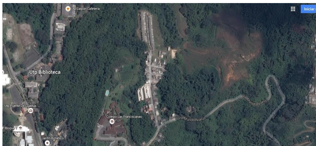
Fotografía 11 Vista Panorámica del Barrio El Bosque

Como quiera que sea, es el hombre quien va dándole sentido social, cultural a su entorno, transformándolo y apropiándose de su medio ambiente, tanto en términos materiales como simbólicos. Es así, que el espacio socializado y "culturizado" permite crear una identidad, un sentido de pertenencia, unas relaciones y redes entre los grupos que lo conforman. Convirtiendo al territorio, al espacio y los lugares, en los elementos que hacen al hombre en creador de cultura, con base en las tradiciones, historias familiares y colectivas, del recinto que ocupa. (Ontiveros & Freitas, 2006, pág. 225)