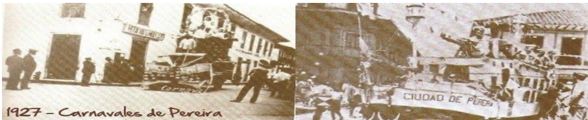
Fotografía 9 Carnavales de Pereira (Andrade F. d., 1927)

De aquí que, la apropiación de los espacios públicos sea una experiencia generalizada del ser humano, la cual se lleva a cabo, a partir de la construcción socio-histórica de esa realidad, apoyada en la praxis, y que, da paso a la conciencia tanto individual como colectiva (Rodríguez, 2014). Es por esto que la apropiación del espacio, se convierte en un proceso simbólico que se origina a partir de las interacciones cotidianas entre las personas y los espacios, llevando a producir vínculos, relaciones simbólicas y afectivas que tienen como resultado, el afloramiento del sentido de pertenencia y apropiación que lo convierten en un lugar cargado de significaciones sociales. (Lindon, Aguilar, & Hiernaux, 2006)