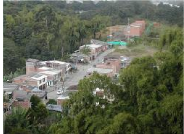
Fotografía 15 Urbanización Rincón del Bosque (Prieto, 1986)

En cuanto a la urbanización Rincón del Bosque, esta se encuentra ubicada en la parte baja del sector, conformada por 60 casas y 2 locales comerciales. Dentro de la estructura de la urbanización, no se cuenta con espacios públicos donde la comunidad pueda reunirse. Por lo que, al hacer un análisis, se puede observar que el barrio el Bosque fue producto de un sistema de autoconstrucción, el cual se desarrolló a medida y a la capacidad de sus ocupantes, a diferencia de la urbanización, dejando como resultado, un crecimiento desordenado. (MURILLO, 2008)