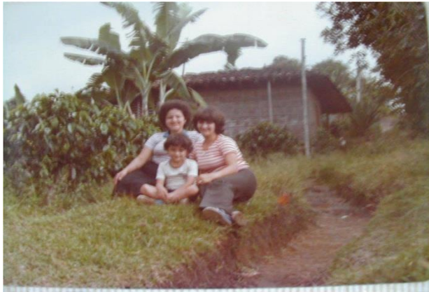
Fotografía 10 Las Primeras Familias Del Barrio El Bosque (Prieto, 1986)

Por lo que, la vereda, el barrio y la ciudad como hábitat, son el resultado de utopías y sueños; lo cual significa proteger, sentir y mantener comunicación con la tierra y con quienes la habitan, pues para el hombre el hacer parte de la construcción de su entorno, es pensarse como parte de él.