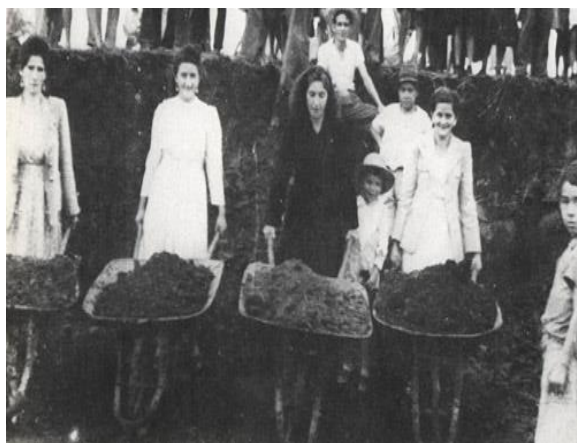
Fotografía 2 Convite para la construcción del aeropuerto Matecaña - 1944. (García, Convite)

Con lo anterior, podemos afirmar que la historia de una ciudad es la que se entreteteje en su espacio público, lugar donde se dan las relaciones entre los habitantes, como entre el poder y la ciudadanía, los cuales se materializan y se expresan en la conformación de las calles, las plazas, los parques, entre otros. (Becerril, 2016, pág. 171)