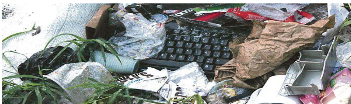
Fotografía 17 Basurero (Diario, 2017)

Sin embargo, en el caso de la Urbanización Rincón del Bosque, su comunidad ha establecido con el territorio una apropiación “utilitaria funcional”, en la cual, el espacio es utilizado por sus habitantes, como zona de tránsito de animales domésticos, basurero, parqueadero de vehículos y para el consumo de sustancias alucinógenas, lo cual, ha llevado a que las personas que allí habitan, perciban estos espacios como lugares ajenos a sus necesidades, provocando indiferencia, baja participación en la recuperación y embellecimiento de los mismos.