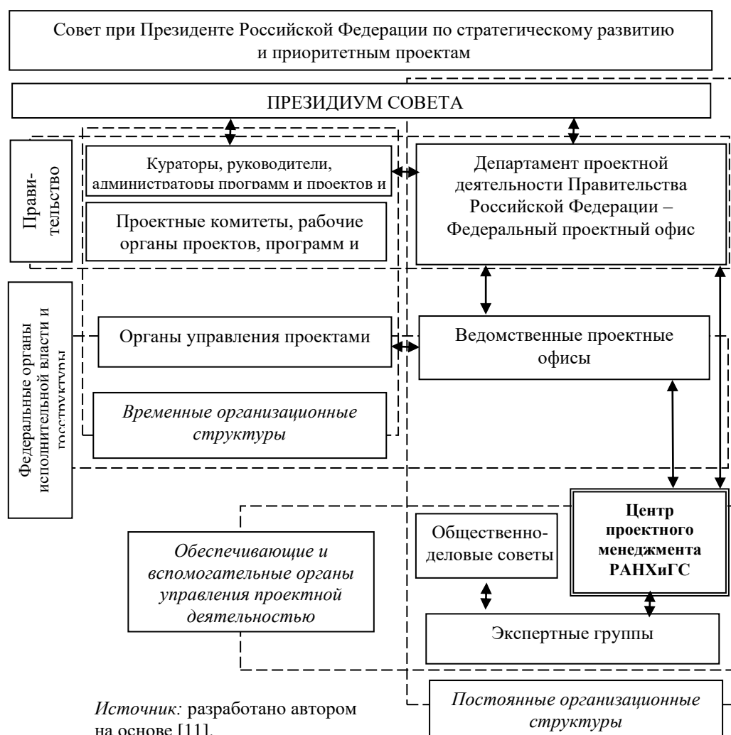
Р и с . 3. Место Центра проектного менеджмента РАНХиГС в структуре управления проектной деятельностью на федеральном уровне

Согласно распоряжению Правительства Российской Федерации от 25.01.2018 № 80-р «О плане мероприятий по развитию проектной деятельности в Правительстве Российской Федерации на 2018 год» второй половине 2018 г. запланированы к реализации следующие мероприятия в сфере развития проектных компетенций: