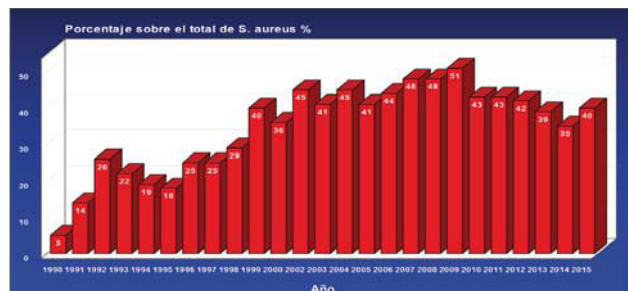
Figura 3: Evolución del porcentaje de SARM en infección nosocomial en España.