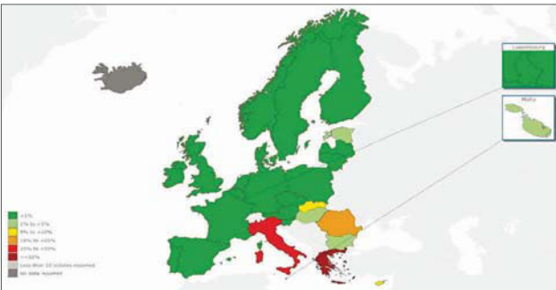
Figura 2: Porcentaje (%) de aislamientos por Klebsiella pneumoniae (KP) resistentes a carbapenems en la Unión europea, 2012.