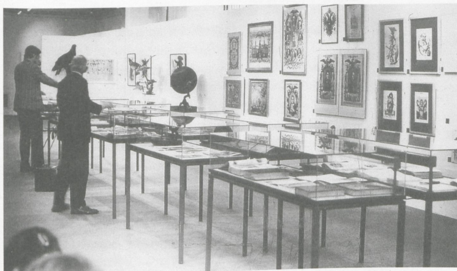
5 Marcel Broodthaers, «Musée d'Art Moderne, Département des Aigles, Section des Figures (Der Adler vom Oligozän bis heute)», Städtische Kunsthalle Düsseldorf, 1972

1960er- beziehungsweise 1970er-Jahren mit einer Position aus den 1990er-Jahren konfrontieren.