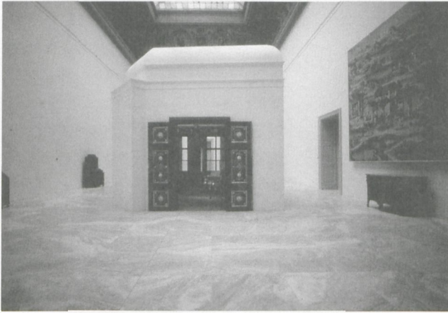
3 MAK – Österreichisches Museum für angewandte Kunst, Wien, Schau- raum Barock Rokoko Klassizismus, Entwurf: Donald Judd