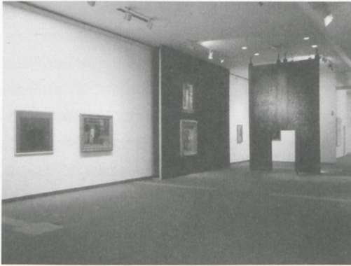
1 museum kunst palast, Düsseldorf, Künstlermuseum, 1. Obergeschoss Nord (Raum VI): Blick auf eine Moscheetür (Ägypten, 15. Jahrhundert), links Bilder von Josef Albers und Eglon Hendrik van der Neer

grossformatige Gemälde der Düsseldorfer Malerschule stehen Rücken an Rücken auf Rollwägen. Huber und Ecker machten aus der Not eine Tugend: Weil die Bilder keinen Platz in der neuen Konzeption fanden, wegen der zu kleinen Türen aber auch nicht abtransportiert werden konnten, wurde aus ihnen eine Art mobiles Depot gebildet, das als Archiv innerhalb des Archivs Museum auf dessen Funktionen verweisen soll.