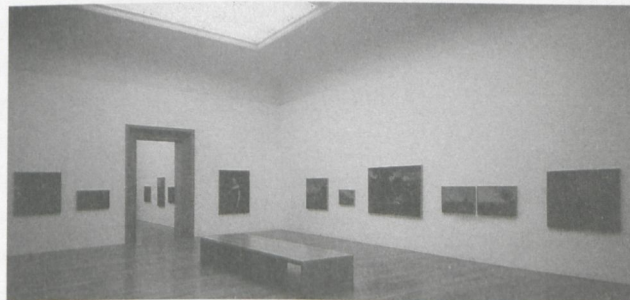
8 «Wiesbadener Gemälde des 19. Jahrhunderts – präsentiert durch Gotthard Graubner», Ausstellung im Museum Wiesbaden 2002

Nachdem bislang von fiktionalen Museen von Künstlern und vom Künstler als Ausstellungskurator die Rede war, sollen nun abschliessend zwei künstlerische Arbeiten vorgestellt werden, in denen das Museum als Arena, als Ort und Medium künstlerischer Intervention und Reflexion fungiert. Der französische Konzeptkünstler Daniel Buren zeigte 1975 im Städtischen Museum Mönchengladbach die Ausstellung «A partir de là ...» (Abb. 9). Dabei verhängte der Künstler die Wände mit gestreiften Stoffbahnen und sparte aus diesen die Formate von Bildern aus, die während verschiedener Sonderausstellungen des Museums in den zurückliegenden Jahren von Museumsleiter Johannes Cladders an genau diesen Stellen präsentiert worden waren. Während üblicherweise der Museumsleiter eine Retrospektive des Künstlers organisiert, liess in diesem Fall der