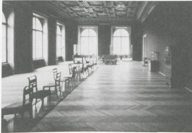
4 MAK – Österreichisches Museum für angewandte Kunst, Wien, Schau-sammlung Empire Biedermeier, Entwurf: Jenny Holzer

besorgten. Ein entscheidender Unterschied ist zudem, dass in Wien die traditionelle chronologische Epochengliederung des Museums beibehalten wurde.