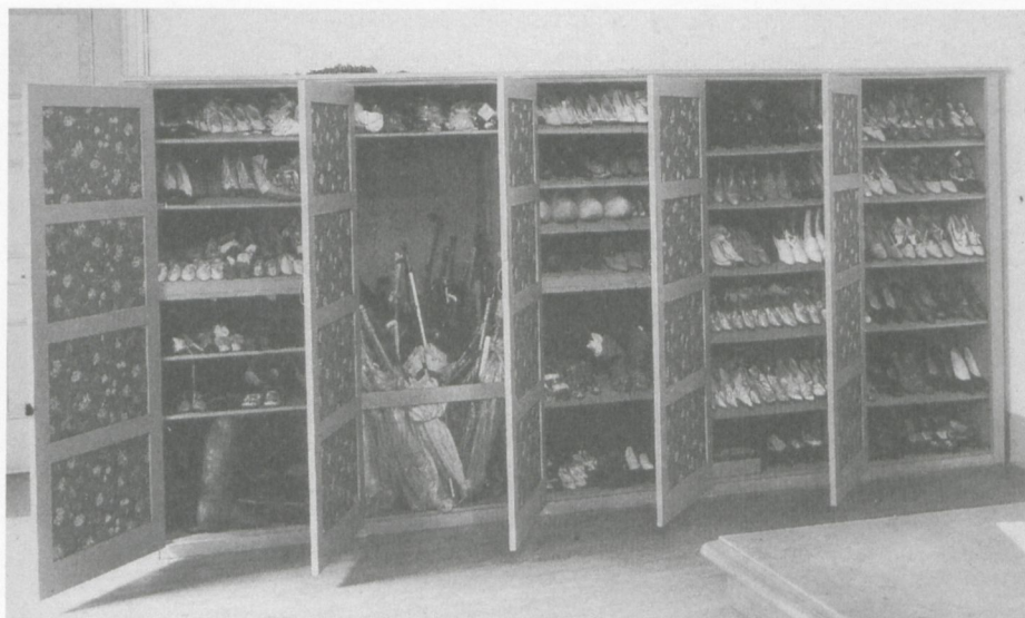
7 Andy Warhol, «Raid the Icebox I with Andy Warhol – An Exhibition selected from the storage vaults of the Museum of Art, Rhode Island School of Design», Ausstellung, zusammengestellt aus den Museumsdepots des Museum of Art, Rhode Island School of Design, Providence, Rhode Island, 1970

wahl und Inszenierung weder Rücksicht auf die üblichen kunsthistorischen Kategorien noch auf Qualität, Wert und Erhaltungszustand der Objekte nahm. Bilder und Stühle, Skulpturen und ausgediente Vitrinen, Tapeten und mit Schuhen und Schirmen gefüllte Schränke – alles war für Warhol gleichwertig, und so unterschiedslos wurde es auch präsentiert, allen musealen Gepflogenheiten zum Trotz. Und noch etwas verblüffte: Warhol verwandelte die Ausstellungsräume kurzerhand in Depots, indem er die dortigen Aufbewahrungsvorrichtungen – Vitrinen, Gestelle, Regale, Schränke – übernahm. Warhol war vermutlich der erste Künstler, der im Auftrag eines Museums eine Sonderausstellung aus den Sammlungsbeständen zusammenstellte. Seither geschieht das immer wieder und an verschiedensten Orten.