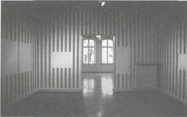
9 Daniel Buren, «A partir de là ...», 1975, Installation im Städtischen Museum Mönchengladbach

Künstler die Ausstellungstätigkeit des Museumsleiters Revue passieren. Typisch für Buren sind die Verwendung der seriell angeordneten vertikalen Streifen, die Ortsbezogenheit und das Temporäre seiner Kunst sowie das Infragestellen der Institution Museum.