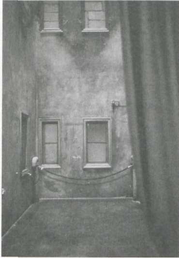
6 Susanne Weirich, «Die Sammlung des Parrhasios – 30 illusionistische Gemälde mit Draperien – Eine Ausstellung», 1992, Installation im Lichtschacht der Galerie Vorsetzen Hamburg

Kunstwerk erklärt und musealisiert, zugleich wurde der Kunststatus durch die Beschriftung negiert.