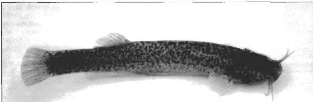
Figura 1. Vista lateral de Trichomycterus davisi . ILPLA 46,85 mm L. est.

FMNH 60309 holotipo, (med.) 41,03 mm L. est., Serrinha Paraná, Brasil, Dec/23/1908; FMNH 58575 paratipo, 9 ejs. (ex. 4) 26,50–41,08 mm L. est., arroyo cerca de Serrinha Paraná, Brasil; FMNH 58118, 4 ejs. (ex.) 43,44–51,54 mm L. est., Morretes, Paraná, Brasil, Ene/04/1909; ILPLA 1071, 1 ej.