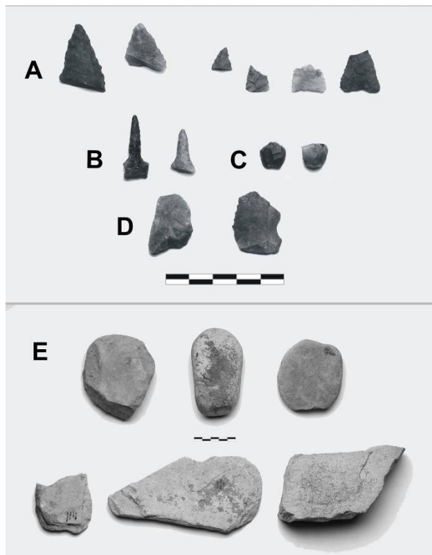
Figura 2. Artefactos líticos del sitio Paso Vanoli: A: Puntas de proyectil; B: Perforadores; C: Raspadores; D: Filos marginales; E: Artefactos formatizados por picado, abrasión y uso.

Los artefactos formatizados (n= 16) presentan un alto grado de fragmentación (81%). El trabajo realizado para la formatización abarca bifaces y unificiales marginales. Los grupos tipológicos representados son puntas de proyectil, raspadores, perforadores, lasca con escotadura y cuatro fragmentos de artefactos indeterminados (Figura 2).