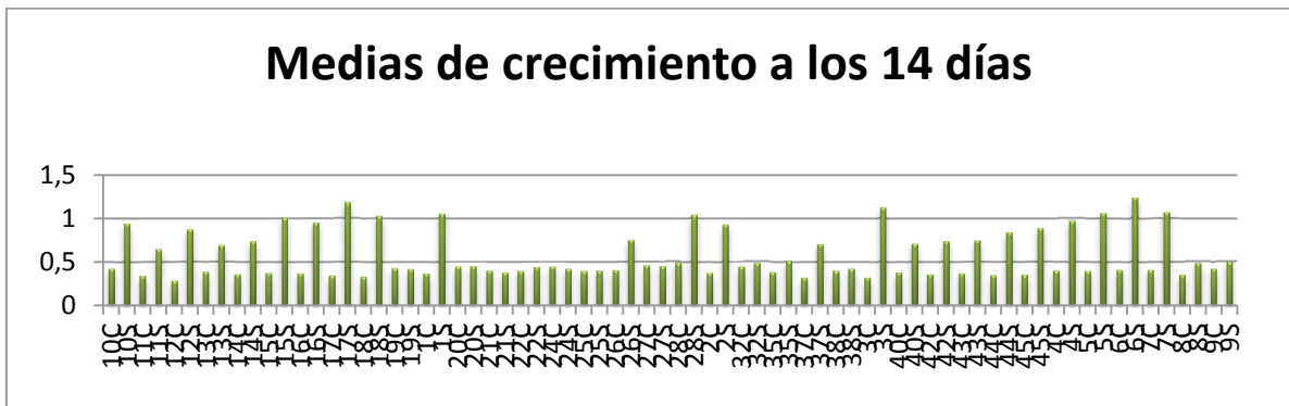
Figura 3. Tasa de crecimiento de los aislados de Z. tritici a los catorce días de incubación

Eje horizontal, aislados de Z. tritici ; eje vertical radio promedio en cm; 10C, 10S es el número del aislado creciendo con y sin fungicida