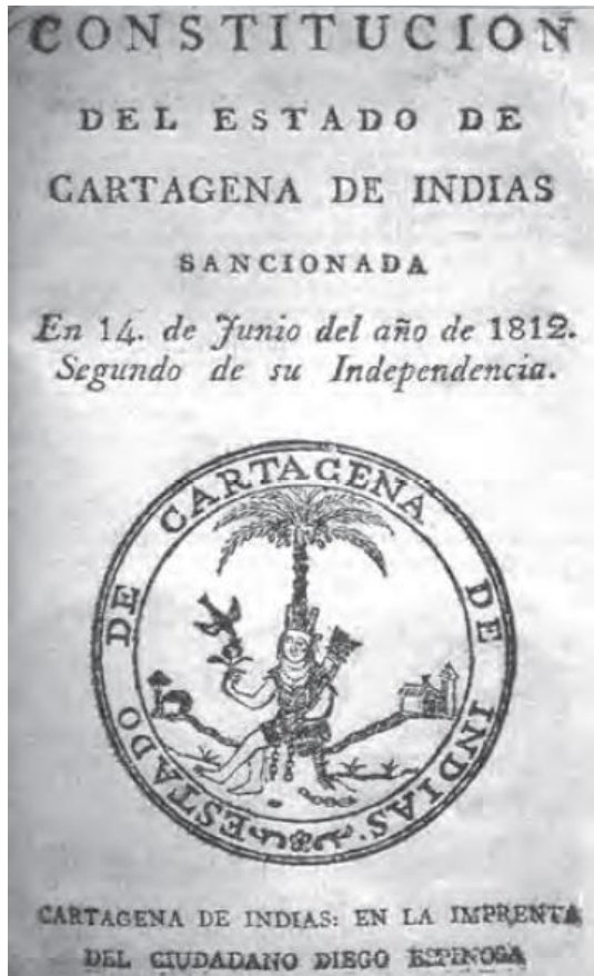
Ilustración 8: Constitución del Estado de Cartagena de Indias. Heráldica y Xilografía en la Independencia y en la República de Colombia. Boletín de Historia y Antigüedades 1812.