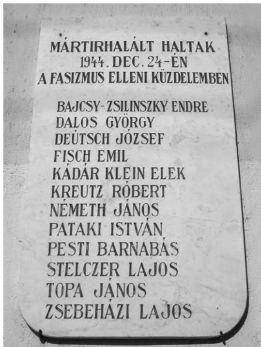
9. fénykép: A kivégzett mártírok emléktáblája a sopronkőhidai fegyház falán