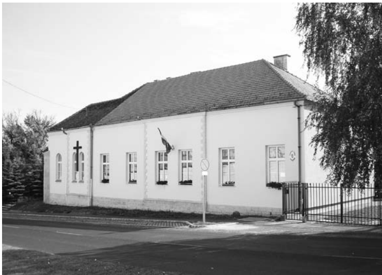
4. fénykép: A sopronkőhidai iskola

A Sopront és környékét ért amerikai és orosz bombatámadások elkerülték Sopronkőhidát. A Számonkérő Különítmény hadbírószága szinte folyamatos ítélezett, a légiriadók és bombázások zavart okoztak ugyan, de nem akadályozták hadbírószág munkáját. [111] Nem így az 1945. február 16-án, kiütéstífusz miatt a fegyházban elrendelt vesztegzár: megszűntek a kihallgatások és a tárgyalások. [112] Így a 3–6 hét hosszúra becsült egészségügyi zárlat többek életét megmenthette volna. Nem így történt azonban, mivel a zárlatot alig egy héttel később, február 22-én feloldották. [113] A hadbírószág ezután újult erővel folytatta a kihallgatásokat és tárgyalásokat. A sopronkőhidai halálos ítéletek kiszabása és a kivégzések tovább folytatódtak. A rögtönítélő bíróság ítélete ellen fellebbezésnek nem volt helye. A halálos ítéleteket a kihirdetést követő két órán belül, vagy másnap reggel hajtották végre a fegyház udvarában. [114] A siralomház a fegyház III. emeletén volt. [115] A kivégzettek földi maradványait a rabtemetőben temették el. [116]