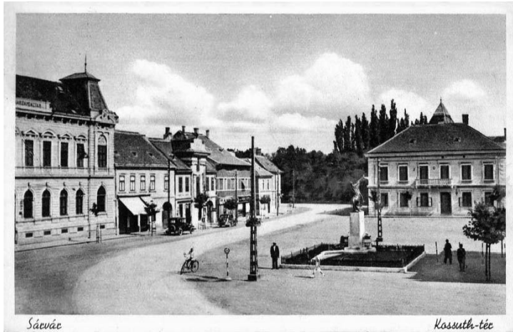
5. fénykép: A kivégzés helyszíne Sárváron (képeslap az 1940-es évekből)