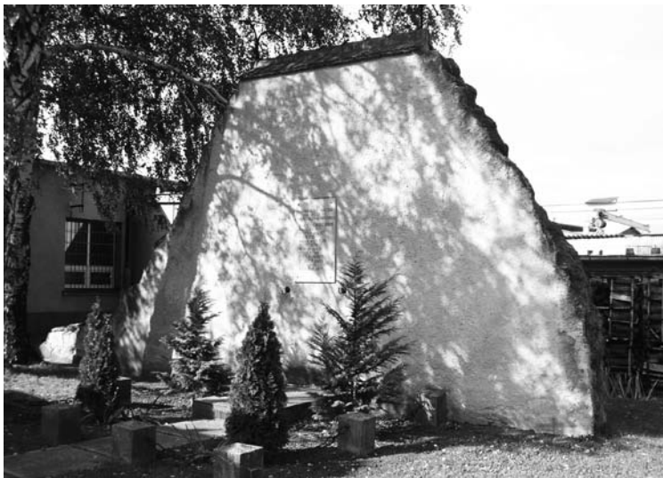
3. fénykép: Kivégzőfal a sopronkőhidai fegyházban. [75]