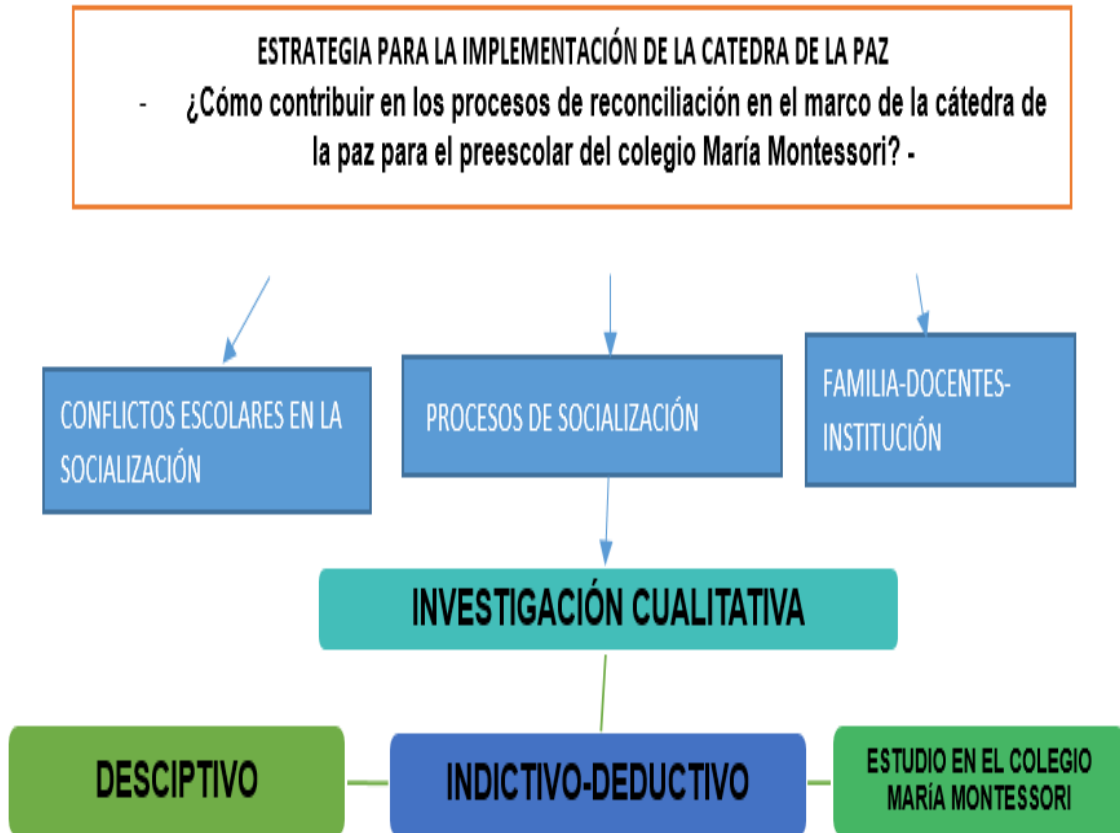
Figura 1. Metodología general de la investigación