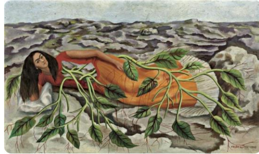
Figura 4. Frida Kahlo, Raíces (1943), óleo sobre tela.

Vemos um autorretrato de Frida Kahlo (Figura 4), uma mulher coberta por folhagens verdes que brotam do seu corpo deitado no solo e vestido com roupas típicas das mulheres campesinas do México. Frida, assim como Mendieta, enveredou por um processo ativo de construção de si como mulher de um país periférico em relação aos Estados Unidos, demarcando a sua alteridade na casa que pintou com as cores da periferia mexicana, nas roupas que escolhia para si. A busca de referências ao matriarcado e da ancestralidade de culturas subalternas marcou não apenas Mendieta, mas toda um conjunto de mulheres artistas feministas em busca de um novo vocabulário expressivo e conceitual (Archer, 2001).