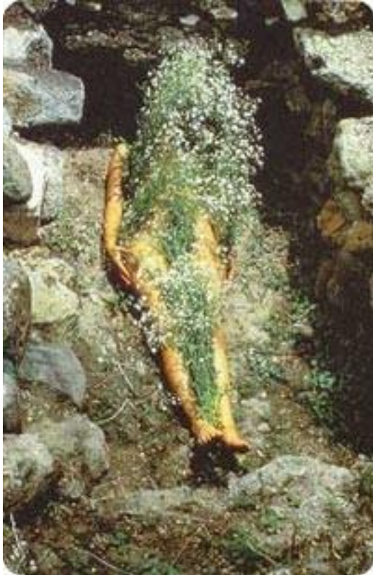
Figura 3. Ana Mendieta, Flores sobre o corpo (1973), performance.

lowa, foi assim que ela começa a sentir suas raízes se fortificando em seu corpo. El Yagul é um sítio arqueológico Zapoteca em Oaxaca, México e é um lugar considerado sagrado para a cultura Zapoteca.