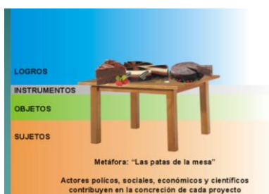
Figura 1: EIDT, metáfora de la mesa.

Desde este punto de vista, es preciso cuestionarse las condiciones bajo las que la “mesa” del EIDT es (o puede ser) tan horizontal como se requiere y como quisiéramos. Los casos siguientes permiten reflexionar acerca de los actores y sus capacidades para “modelar” los escenarios de intervención, de liderar y determinar transformaciones territoriales, de identificar oportunidades de crecimiento alternativo y de ofrecer las bases de conocimientos científicos necesarios para delinear estrategias y políticas para construir territorios sustentables.