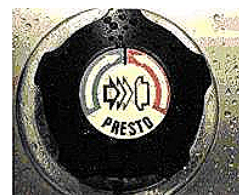
Figura 2: Dibujo de la consigna de la primera actividad de foro, basado en la observación [13].

al tema usabilidad desde diferentes puntos de vista. La actividad fue pública, asincrónica y simétrica. Se trató de una actividad de observación, bajo la forma de un foro, con la siguiente consigna: “ La interacción nos envuelve en nuestro día a día, interactuamos con objetos a través de múltiples formas: el pomo de una puerta, el manillar, sillín, pedales y frenos de una bicicleta y hay interfaces bien diseñadas y otras no. Fijaros en este grifo de ducha (Ver Figura 2). ¿Qué “errores” de interacción observáis? ”