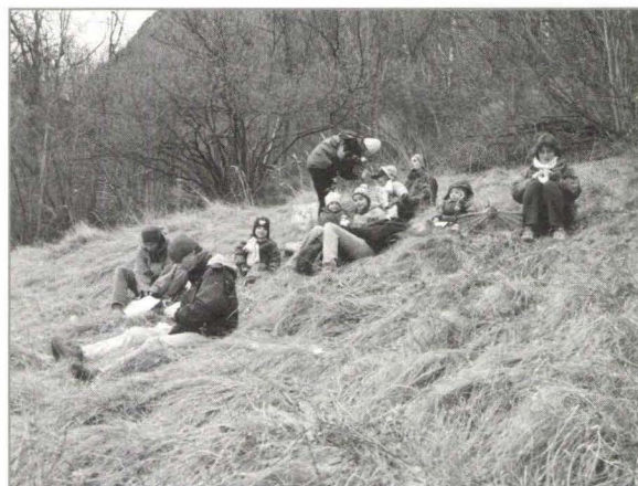
Pique-nique en famille dans l'herbe sèche du Rosel.