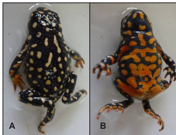
Figura 2. Vista dorsal (A) y ventral (B) de Melanophryniscus fulvoguttatus (MNHNP 11484).

Comentarios. — Melanophryniscus fulvoguttatus (Mertens, 1937) se encuentra presente en Brasil en el Estado Matto Grosso do Sul (Prigioni y Langone, 1998) y en Argentina se restringe a la provincia de Formosa (Lavilla et al. , 2002). Anteriormente se encontraba citado para las provincias de Santa Fe (Baldo y Arzamendia, 1997) y Santiago del Estero (Basso y Williams, 1996) pero el reexamen del ma-