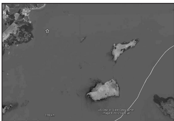
Figura 1. Localidad de colecta (estrella). Isla Yacyreta. Presa del A° Aguapey – Embalse Yacyreta – Río Paraná. (27°22'39,79" S y 56°14'42,19" O). Mapa: Google Earth (mayo, 2010)

Localidad. — República del Paraguay. Departamento de Itapúa. Distrito San Cosme y Damián. Remanente de la Isla Yacyreta, margen derecha, 27° 22' 39,76" S y 56° 14' 42,19" O. (Fig. 1). El sitio de colecta está conformado por un mosaico de esteros, pastizales en suelos saturados o inundados, vegetación hidromórfica permanente y bosques en islas (Cubas et al. , 2008). Colectores: Katia Airaldi Wood y Viviana Rojas Bonzi. Fecha de colecta: 3 de febrero de 2011. Los materiales de referencia se encuentran depositados en el Museo Nacional de Historia Natural del Paraguay (MNHNP 11484–91) (Fig. 2). Longitud hocico-cloaca ( en mm) de los ejemplares en orden de numeración: 25, 21, 24, 19, 23, 24, 25 y 25.