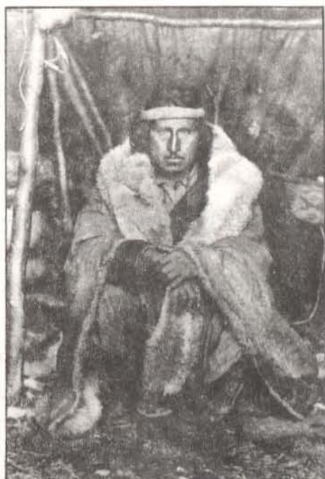
Foto 2: Cacique Manuel Quilchamal en 1895? (Archivo General de la Nación, I 303 585 B 125040)