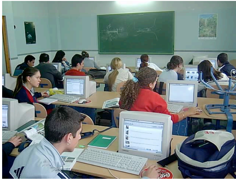
Figura 2. Aula TIC del IES Torre del Prado

La estructura de la red del centro quedó configurada de la siguiente forma: