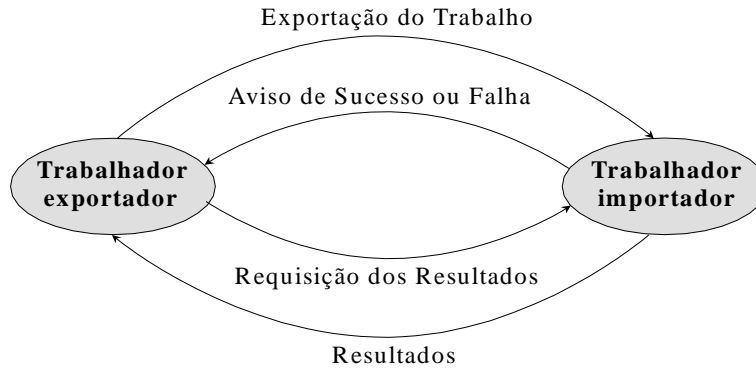
Figura 4.2 - Troca de mensagens para paralelização no OPERA

O custo envolvido na troca de mensagens depende do montante de informações a serem trocadas entre trabalhadores, ou seja, depende do tamanho das mensagens. As únicas mensagens que variam de tamanho são a exportação de trabalho e os resultados . O tamanho da mensagem exportação de trabalho está relacionado com o tamanho dos argumentos de entrada do procedimento. Esse tamanho pode ser obtido em tempo de execução. O tamanho da mensagem resultados está relacionada com o tamanho dos argumentos de saída do procedimento. Esse tamanho pode ser obtido, antes da paralelização do procedimento, através das relações armazenadas nas anotações out_size fornecidas pelo GRANLOG [BAR 00]. Resumindo, o custo para paralelização de um procedimento pode variar de acordo com o tamanho dos seus argumentos de entrada e saída, os quais somente podem ser determinados em tempo de execução. Além disso, esse custo pode ser previsto, antes da execução paralela, através das relações de tamanho entre entradas e saídas.