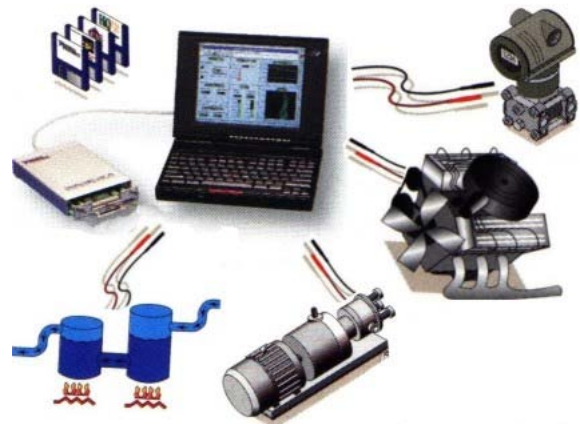
Fig. 2 - Diagrama global del sistema

La placa se materializa conteniendo la FPGA y los dispositivos básicos (convertidor analógico digital, codificador angular, display de siete segmentos, motor PAP). En la Fig. 1 se muestra el diagrama de conexiones sólo de la FPGA con sus conexiones al DB25 y todas las señales necesarias para la configuración.