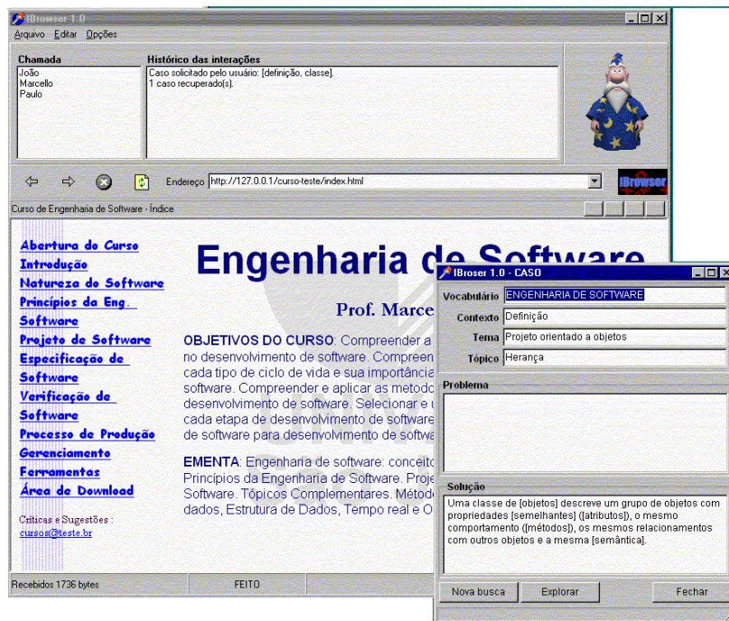
Fig. 2 – Estrutura de comunicação dos componentes da Arquitetura..

O personagem assistente assume o papel amigável do mágico "Merlin". Sua implementação utiliza uma interface com uma biblioteca oferecida pela Microsoft para a construção de assistentes [MICROSOFT 99]. Esta biblioteca oferece ainda a possibilidade de desenvolver novos personagens com animações customizadas.